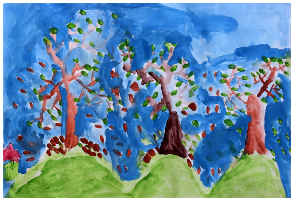
Samo Hercog, 5. a