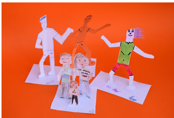
Kiparski prostor, 5. b