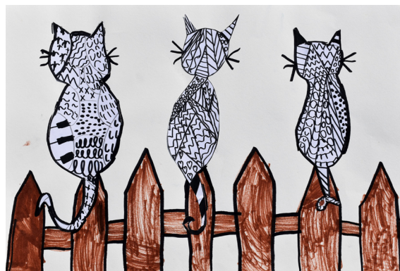
Iris Kramberger, 4. a