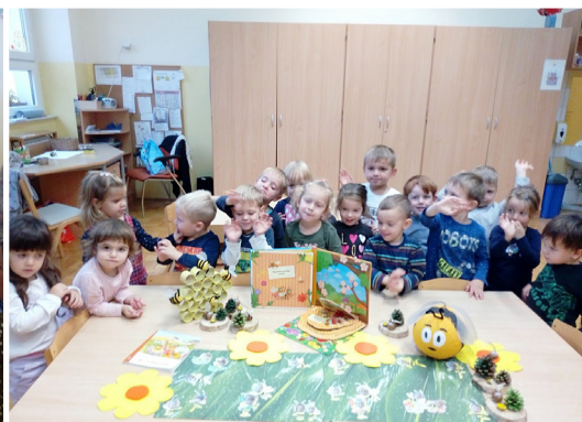
Lunice z vzgojiteljicama