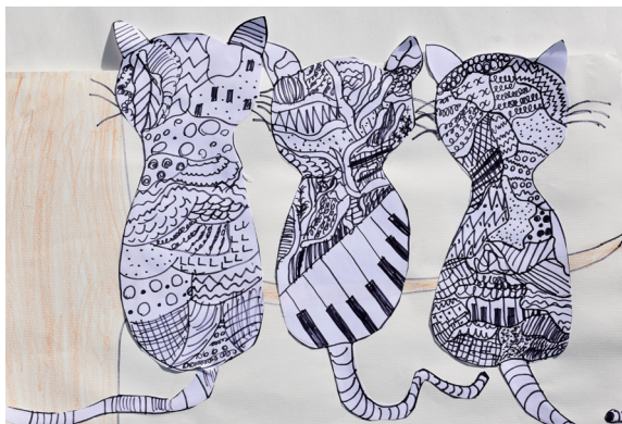
Lucija Sivec, 4. a