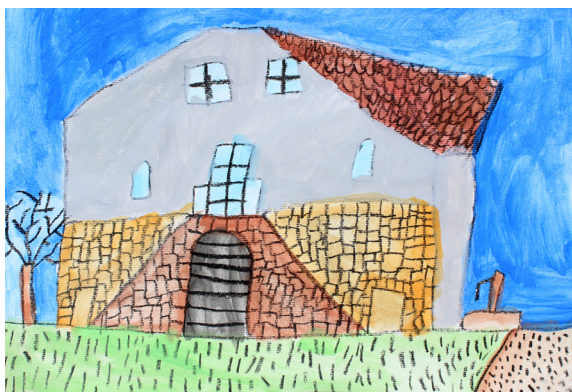
Filip Ferk, 4. a

se, da slike razstavijo in jih podarijo vojašnici. Vsi, ki so si ogledali naši razstavi, so bili nad ustvarjalnostjo tretješolcev navdušeni.