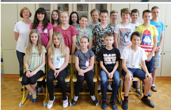
Učenci 9. a