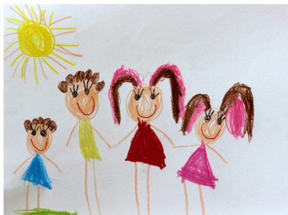
Manca Železnik, 6. let

Peljali smo vrsto projektov na ravni vrtca ali državni ravni: Simbioza giba, Planetu Zemlja prijazen vrtec, Cici vesela šola, NA-MA POTI, športni pro-