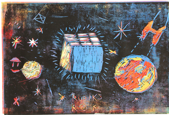
Rok Mišič, 7. b