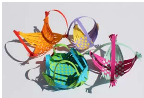
Učenci 5. a

takoj zaljubila vanj. Živela sta srečno do konca svojih dni.