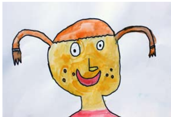
Žiga Godec, 2. a