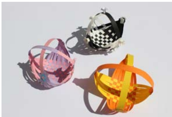
Učenci 5. a