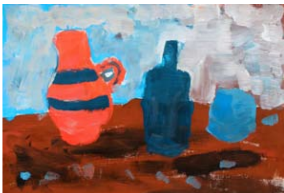
Rok Belčić, 6. a