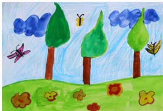
Maruša Vrčko, 5. a