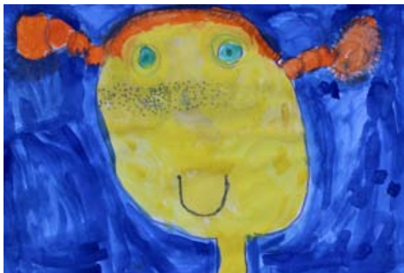
Nejc Kunštič, 2. a