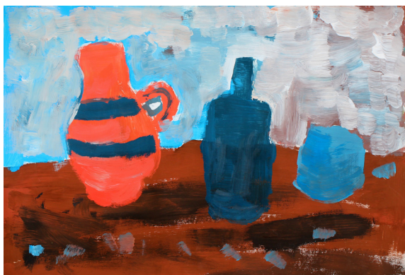
Rok Belčić, 6. a