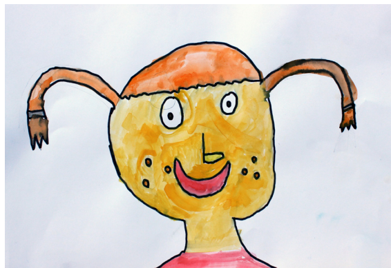
Žiga Godec, 2. a