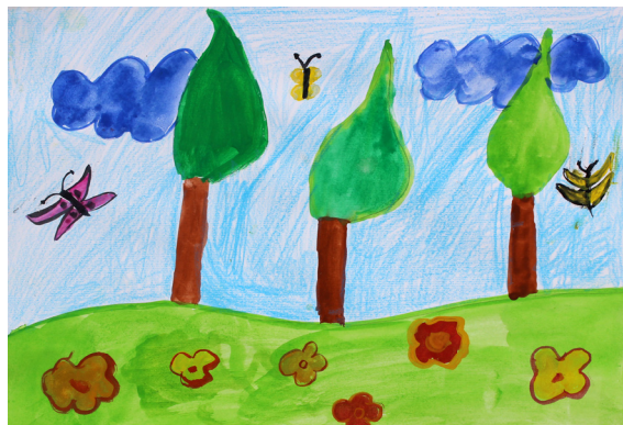
Maruša Vrčko, 5. a