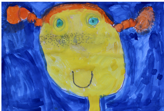
Nejc Kunštič, 2. a