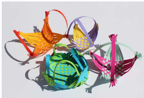
Učenci 5. a

takoj zaljubila vanj. Živela sta srečno do konca svojih dni.