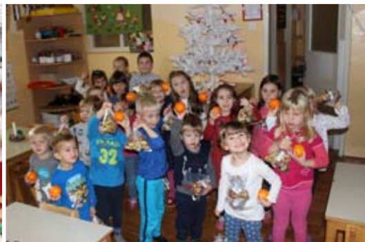
Obiskal nas je Miklavž.