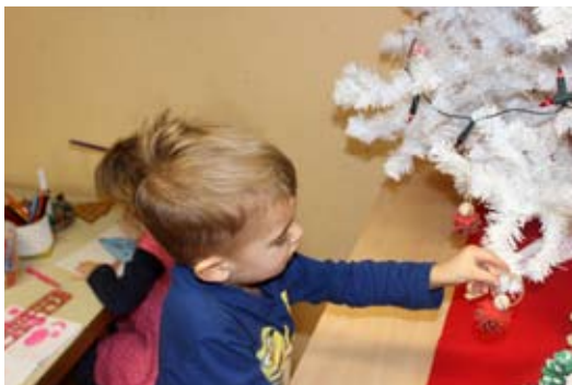
... in jo okrasili.