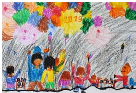
Iva Cerovšek, 2. a