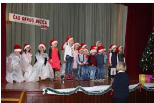
Nastop na prireditvi v Selcah