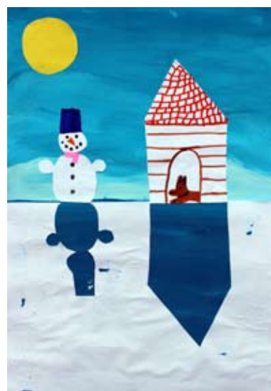
Maja Balaj, 4. a