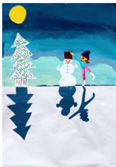
Lia Lucia Kmetič, 4. a