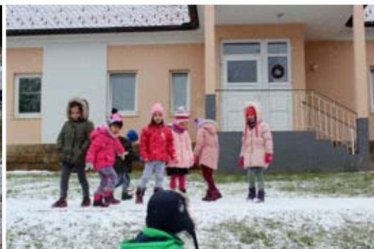
Vrabčki z vzgojiteljicama