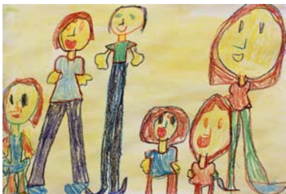
Vita Vogrin, 1. a