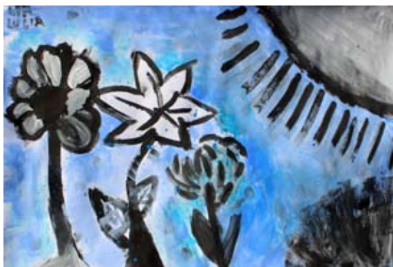
Lia Lucia Kmetič, 4. a

pa se je odpravil še najmlajši princ. Pri njem pa se je zgodba obrnila. Srečal je isto dekle in je sprejel, da se bo z njo poročil. Potem sta skupaj odkorakala naprej. Med potjo ji je povedal, da išče zlato jabolko, ko sta naenkrat opazila, da so še ena vrata in pred njimi je bila čarovnica. Skrila sta se za grm in hotela iti mimo, toda čarovnica ju je opazila. Skoraj ju je začarala v dve žabi, ampak ji je princ vzel palico in jo obrnil proti njej, tako je ona postala žaba. Padli so ji ključi vrat in onadva sta jih pobrala ter vrata odklenila. Za vrati je bilo zlato jabolko. Vzela sta ga in odhitela domov na grad, kjer jo je takoj pokazal očetu.