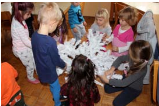
Postavili smo novoletno jelko ...

lo ter novoletno zabavo s plesom. Krajane Selc smo razveselili z nastopom na prireditvi Čas okrog božiča, nas pa je razveselil Božiček. Ker smo zelo pogumni, ustvarjalni, nasmejani in dobri prijatelji, ki se imajo radi, nas je Božiček obiskal še enkrat, in sicer v vrtcu. Prinesel nam je lepa darila, mi smo mu pa zapeli pesmice, pokazali, kako že znamo šteti in mu ponudili naše piškote.