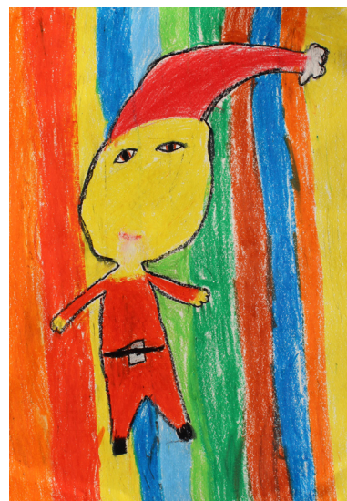
Lara Šinjur, 2. a