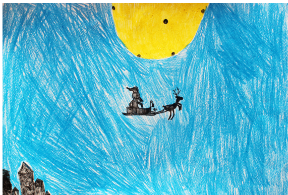
Ela Klara Črešnar, 2. a

Na naslovnico 1. številke smo med drugim zapisali, da si uredniški odbor želi, da bi učenci radi sodelovali in oddajali članke za Šolarčka. Povabili smo