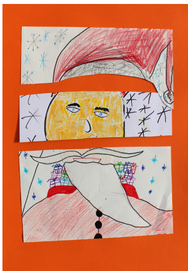
Učenci 5. a