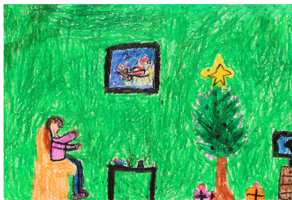
Iva Cerovšek, 2. a

Na poti smo, ker želimo spoznati svet, recimo, kakšen je drugje led,