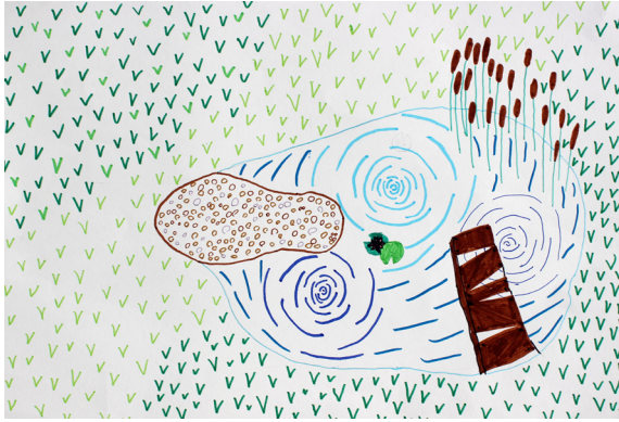
Neža Štruc, 5. a