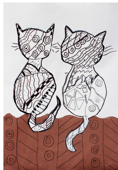
Zala Družovič, 4. a