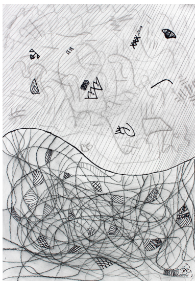
Aljaž Sužnik, 6. a