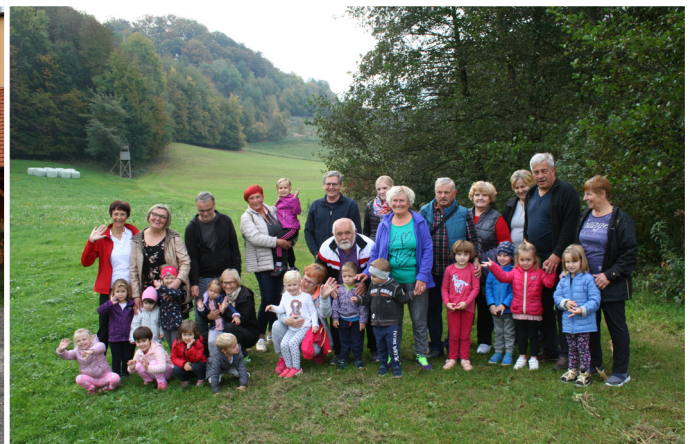
Lunice z vzgojiteljicama