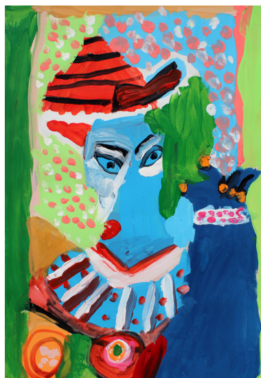
Iris Kramberger, 3. a