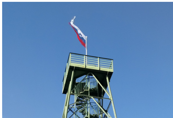
Na Maistrovem stolpu na Zavrhu je zaplapolala slovenska trobojnica.

Posebno mesto v spominskem obeležju je namenjeno času »po Maistru«, spoštovanju in »čaščenju« njegove osebnosti in vojaških zaslug. Pri tem smo iz-