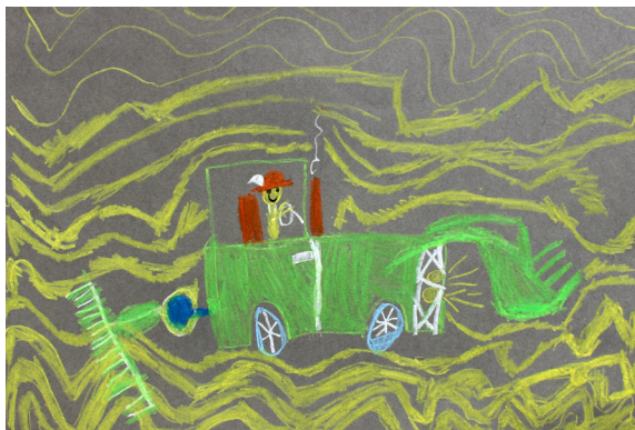
Sinaj Krapež, 2. a