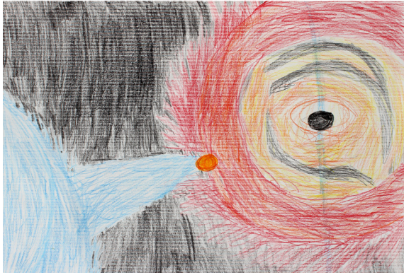
Tai Kmetič, 5. a