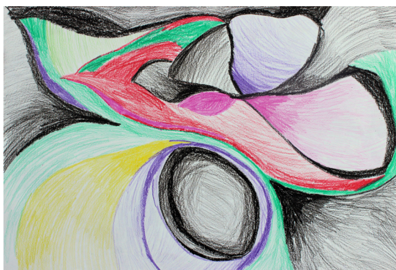
Vitani Šuman, 7. a