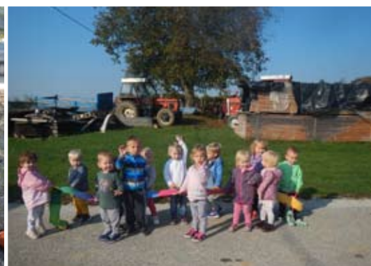
Zvezdice z vzgojiteljicama