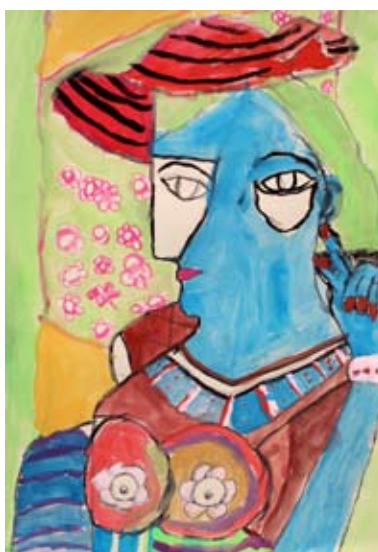
Eva Ornik, 3. a