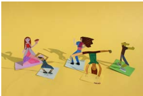
Mija, Neja, Žiga in Maruša, 5. a