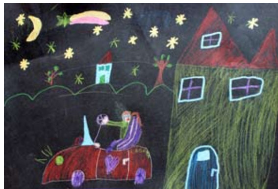
Tjaša Rojs, 2. a