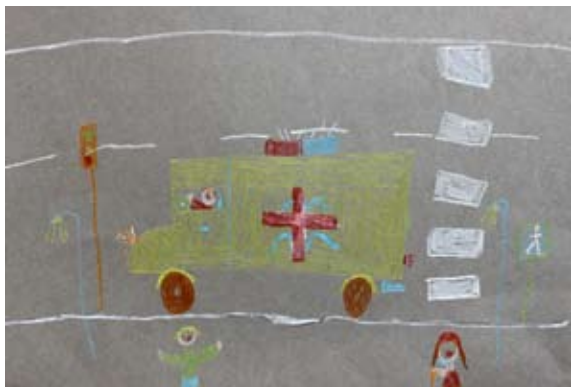
Avrelija Sužnik, 2. a