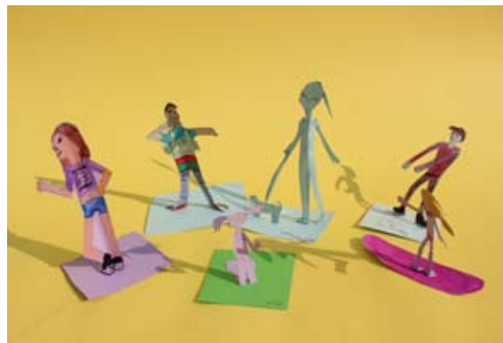
Lana, Maks, Tineja, Tai, Neža in Neja, 5. a