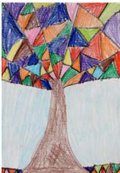
Tia Toplak, 1. a