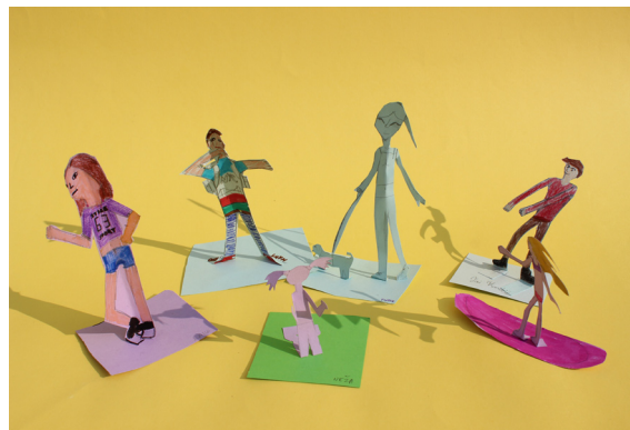
Lana, Maks, Tineja, Tai, Neža in Neja, 5. a