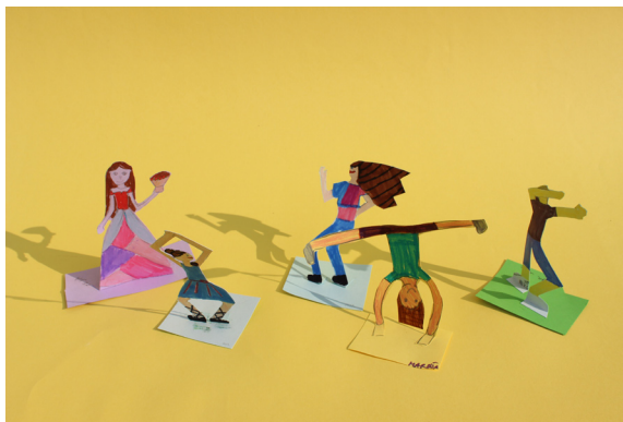
Mija, Neja, Žiga in Maruša, 5. a