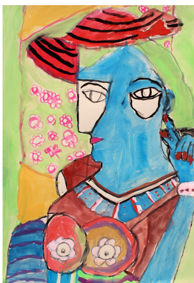
Eva Ornik, 3. a