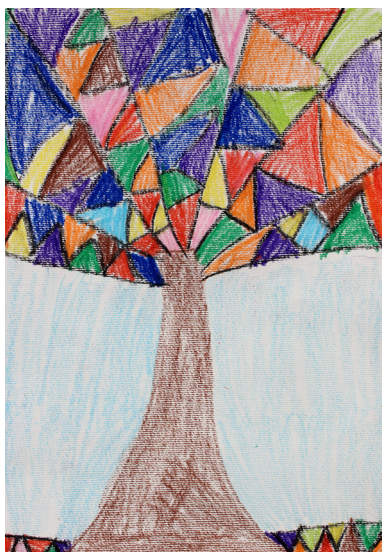
Tia Toplak, 1. a