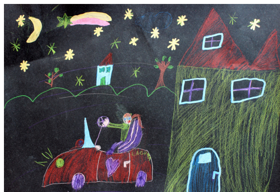
Tjaša Rojs, 2. a