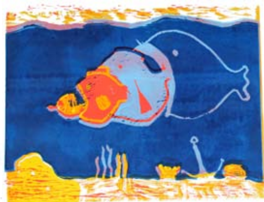
Primož Petko, 7. a