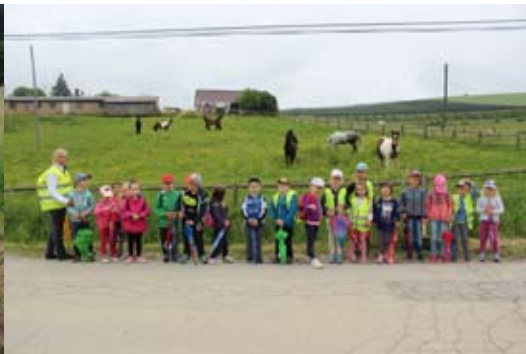
Poziranje s konji