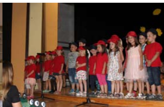
Zaključna prireditev vrta