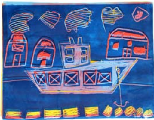
Žan Farazin, 7. a