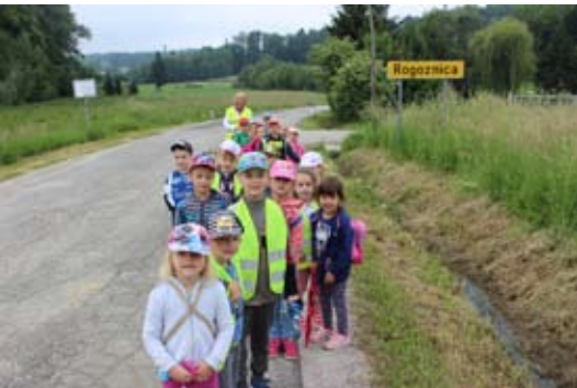
Pohod do Rogoznice

Leto, ki ga zaključujemo je bilo, pestro, dejavno in bogato. Naj bodo počitnice vseh radostne, brezskrbne, sproščujoče.