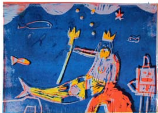
Nejc Letnik, 7. a