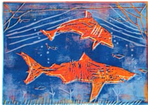
Žan Aleksander Kostanjevec, 7. a