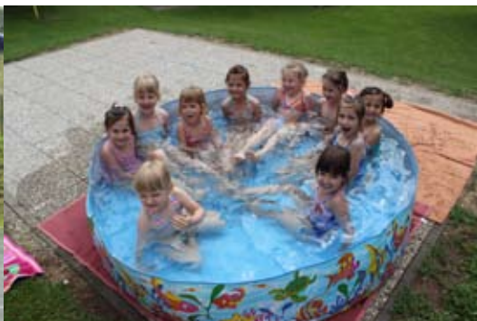
Čofotamo v bazenu