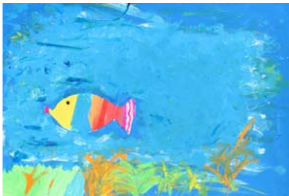
Manja Kurnik in Neja Hadžiselimović, 7. a

Tinkara Štruc je na regijskem tekmovanju iz kon-