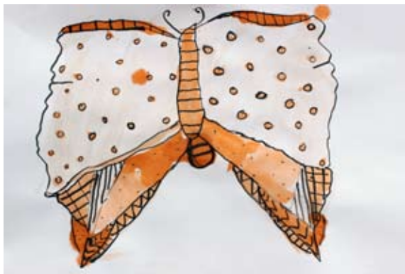
Saška Gavez, 3. a

Junija 2018 je Javni sklad RS za kulturne dejavnosti