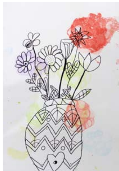
Vita Munda, 3. b

Predsednik Republike Slovenije Borut Pahor se je na povabilo učencev 3. a razreda udeležil 7. prireditve ob praznovanju 260-letnice organiziranega šolstva v