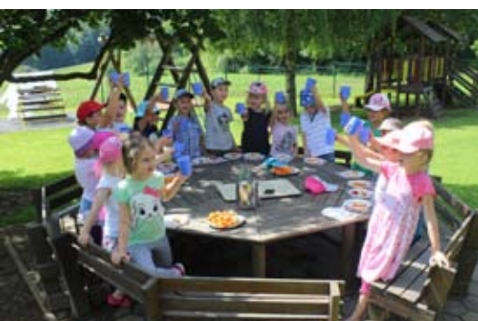
Praznovanje rojstnega dne