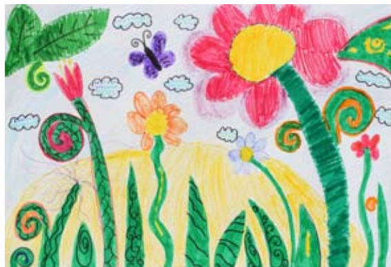
Nika Vnučec Hlupič, 5. a