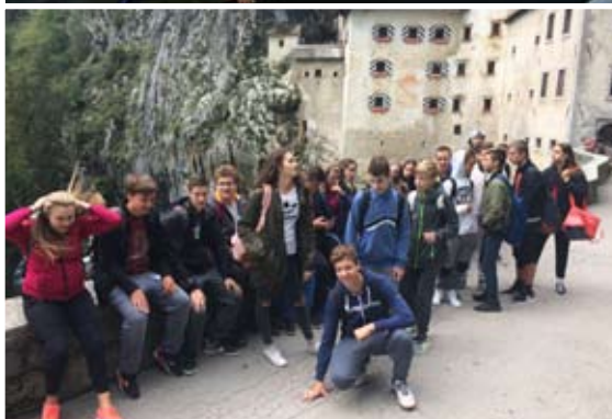
9. a in b razred