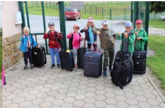
Odhod v vrtec v naravi