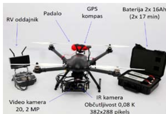
Dron in njegovi sestavni deli

Na tehniškem dnevu smo imeli pet predavanj, ki nam jih je predstavilo nekaj zaposlenih na Univerzi v Mariboru. V zadnji delavnici je bilo govora o e-mobilnosti. Izvedeli smo veliko novega o vozilih nasploh, ultra lahkih električnih vozilih, o postajah za najem e-koles, javni polnilni infrastrukturi, predlogih za uvajanje električnih vozil, o predelavi mestnega kolesa v električno kolo ter o plovih. Med drugim nam je predavatelj tudi opisal in predstavil kvadrokopter oz. dron, kasneje pa smo si ga še lahko ogledali. Izvedeli smo, da dron spada med brezpilotne sisteme, saj nima pilota.