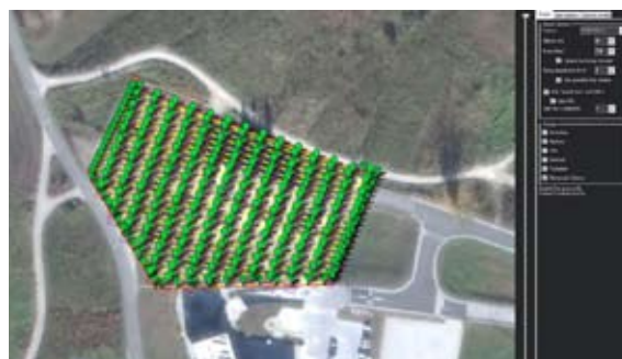
Plan letenja (Mission planner)

O brezpilotnih vozilih pa smo izvedeli, da so to multitronski sistemi s termokamero, temeljijo na geodetski fotogrametrični in radiometrični termografski analizi. Uporabljajo se za različne projekte, in sicer za energetske preglede stavb in industrijskih kompleksov, za preglede mrež daljinskega ogrevanja ter za pregled sončnih elektrarn.