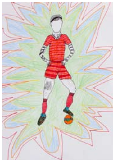
Primož Petko, 7. a