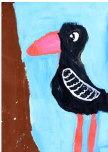
Tineja Rupnik, 4. b