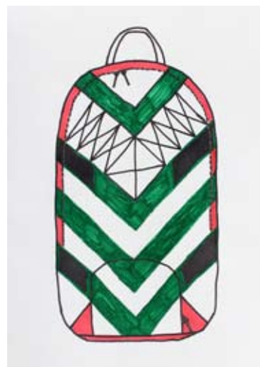
Ambrož Vugrinec, 7. a