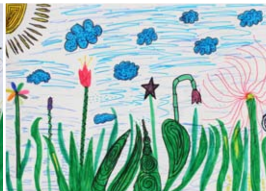
Zoja Lorber, 5. a