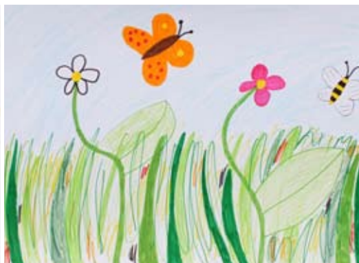
Angelika Rukav, 5. a