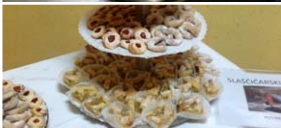
Učenci, prijavljeni k slaščičarskemu krožku