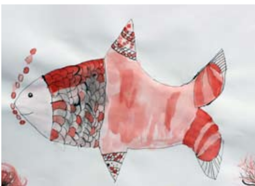
Zala Čuček, 3. a