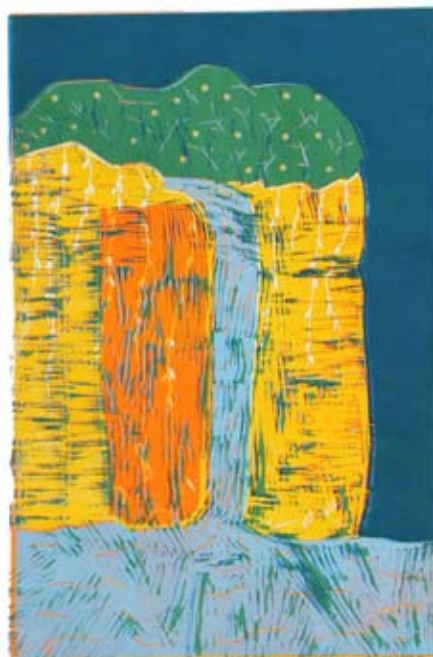
Ambrož Vugrinec, 7. a