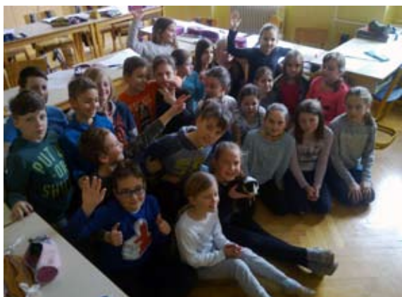
Učenci 4. a in 4. b razreda