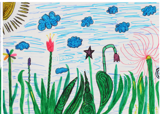
Zoja Lorber, 5. a