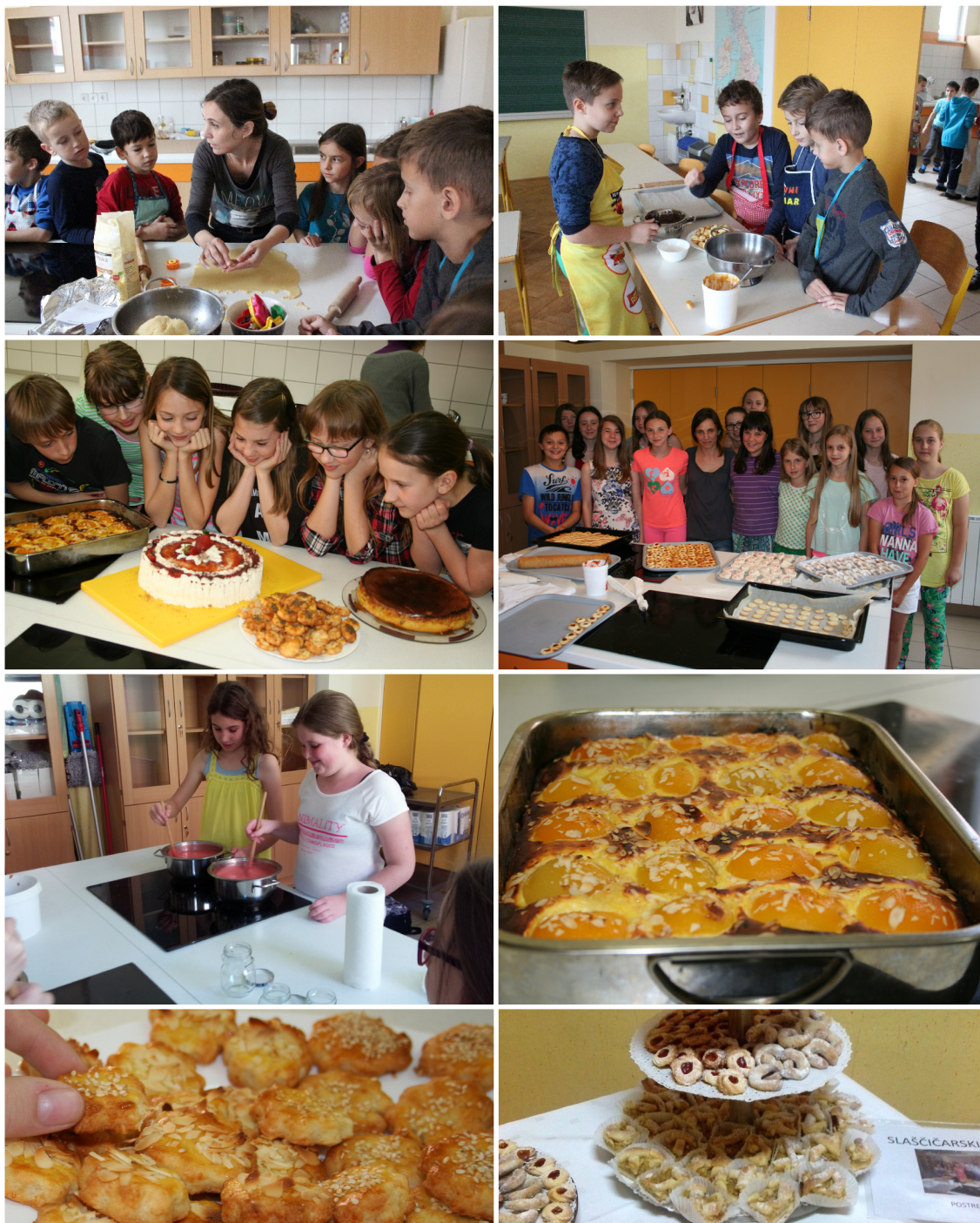
Učenci, prijavljeni k slaščičarskemu krožku

Učiteljici pa se zahvalujemo za vso predano slaščičarsko in kuharsko znanje.