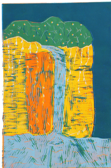
Ambrož Vugrinec, 7. a