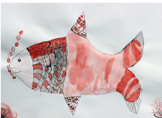
Zala Čuček, 3. a