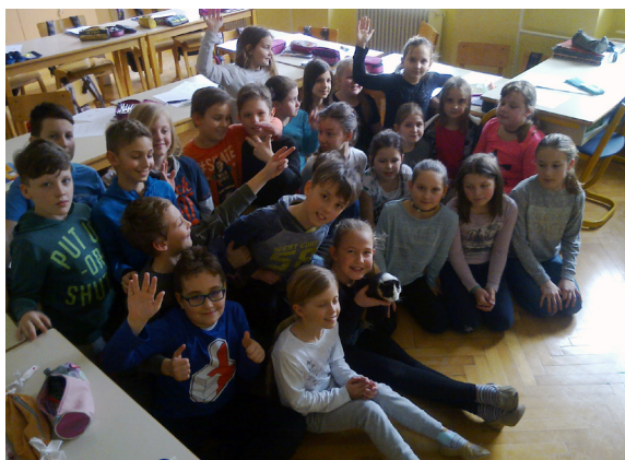
Učenci 4. a in 4. b razreda