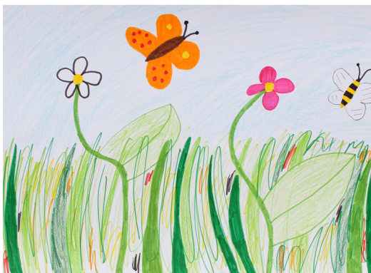
Angelika Rukav, 5. a