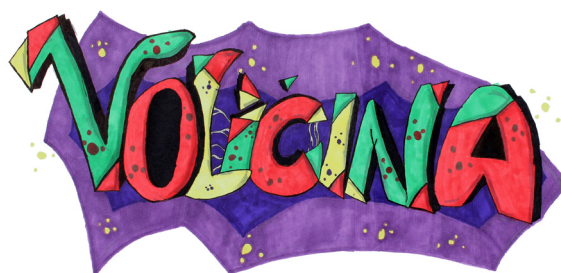
Miha Pliberšek, 9. a

V letu 2017 praznujemo 260-letnico organiziranega šolstva v Voličini. Na 7. prireditvi v sklopu praznovanj, ki je bila 19. 9. 2017, nas je obiskal in bil slavnostni govornik predsednik Republike Slovenije Borut Pahor. Predsednikova prisotnost daje znanju, veščinam in vrednotam, ki jih goji šola, poseben pomen in težo. OŠ Voličina ima v začetku šolskega leta vpisanih 230 učencev v 13 oddelkih, od tega se 2 učenci izobražujeta na domu. Organizirane imamo 4 skupine podaljšanega bivanja v skupnem obsegu 66 ur na teden. Vrtec v začetku septembra obiskuje 81 otrok, ki so razporejeni v 5 skupin. S ponosom ponovno poudarjamo, da je izdajanje šolskega glasila Šolarček posebnost šole v Voličini. Zbrana sredstva sponzorjev in staršev donatorjev šola nameni nakupu igrač, didaktičnih pripomočkov, učil in knjig. Za darovana sredstva se najlepše zahvaljujemo. Strokovni delavci se bomo še naprej trudili, da bodo dejavnosti in pouk potekali kakovostno. Ravnatelj mag. Anton Goznik.