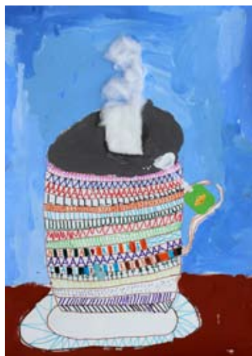
Ambrož Kurnik, 4. b