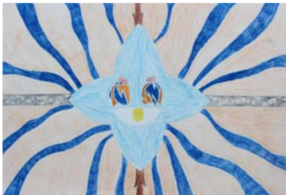
Vid Caf, 8. a

Smilka. Le one so vedele, katera je katera. Kamorkoli gredo, so skupaj. Če ima ena oblečeno modro krilo, bosta tudi drugi dve oblekli modro krilo. Nekega dne pa je mama skuhalo tri stvari. V prvi krožnik je dala juho, v drugega solato in v tretjega lubenico. Mama je rekla, naj se odločijo, katera bo kaj pojedla. Tinka si je izbrala juho, Binka solato in Smilka lubenico. Od takrat so jih ločili, samo vprašati so jih morali, kaj najraje jedo.