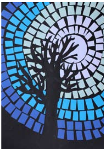
Neja Ditner, 3. b