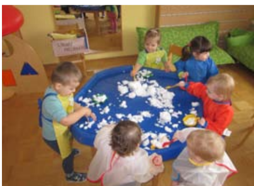
Pečemo snežne potičke