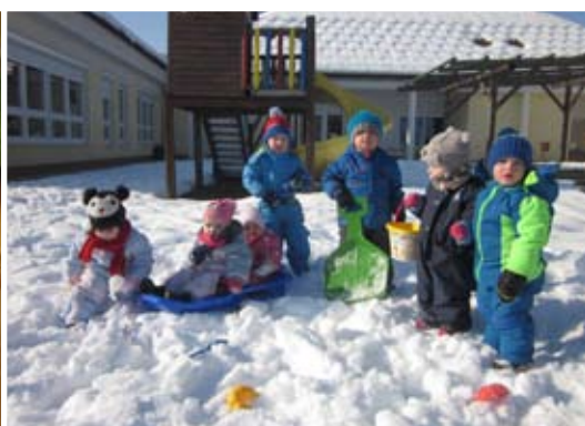
Zimski športni dan

Do prihodnjic vas lepo pozdravljamo iz skupine Snežink.