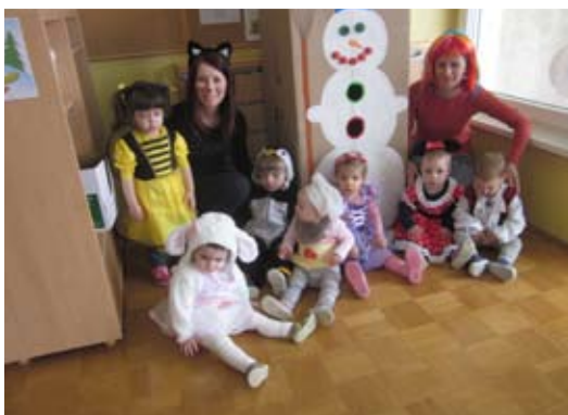
Maske po želji otrok