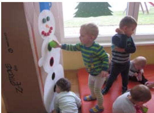
Igra z zelenimi žogicami