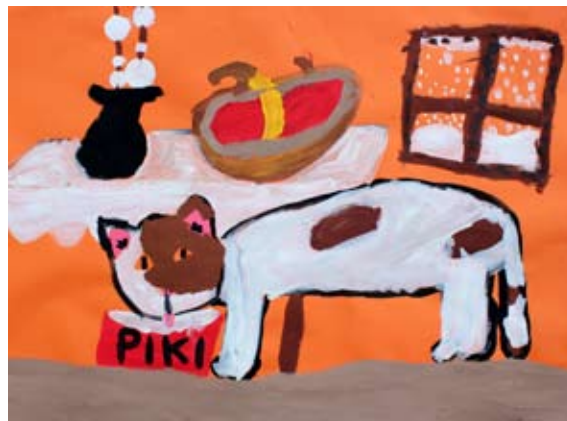
Mellanie Trinkaus, 4. a