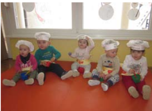
Skupinska maska – kuharji