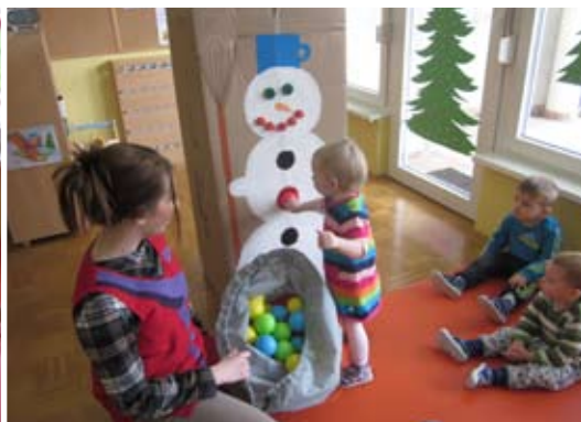
Spoznavamo rdečo barvo