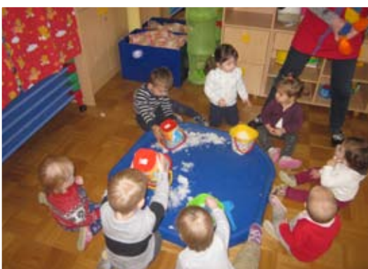
Igra s snegom v igralnici