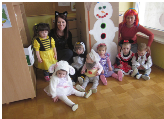
Maske po želji otrok