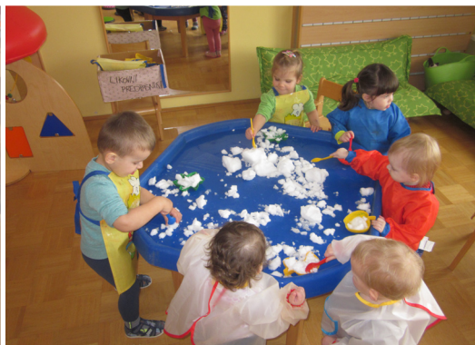
Pečemo snežne potičke