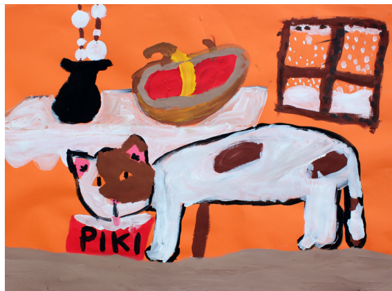
Mellanie Trinkaus, 4. a