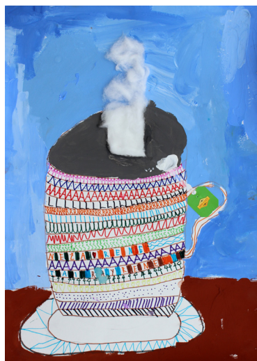
Ambrož Kurnik, 4. b