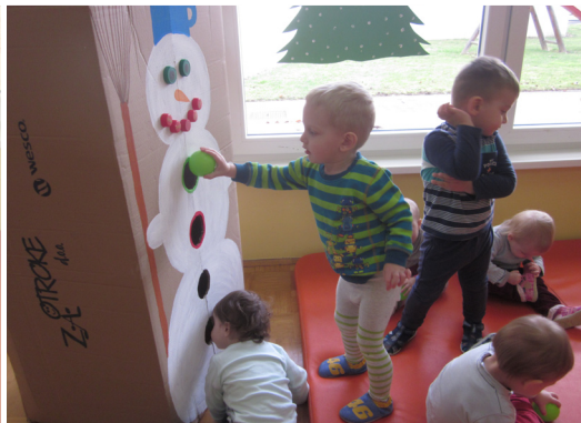
Igra z zelenimi žogicami