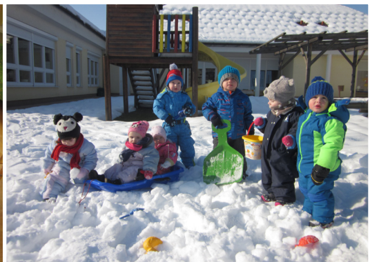
Zimski športni dan

Do prihodnjic vas lepo pozdravljamo iz skupine Snežink.