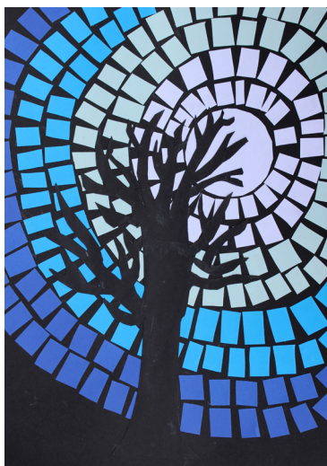
Neja Ditner, 3. b