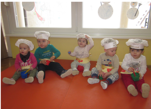
Skupinska maska – kuharji