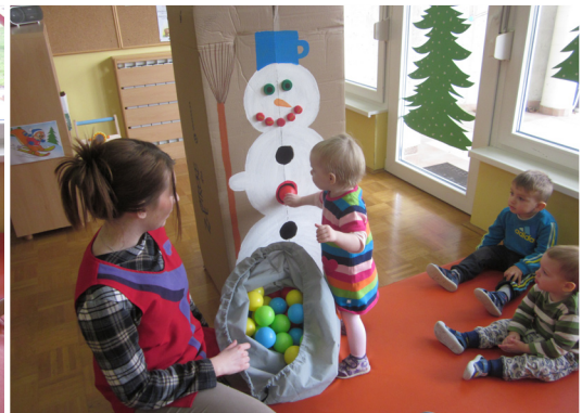
Spoznavamo rdečo barvo