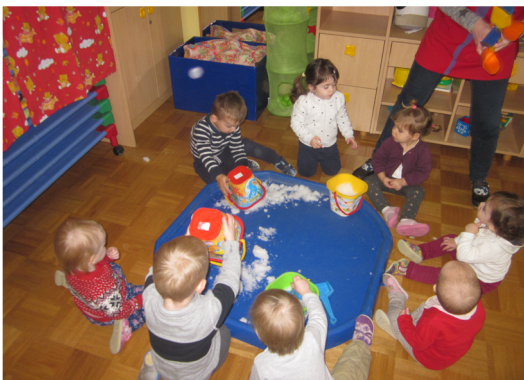
Igra s snegom v igralnici