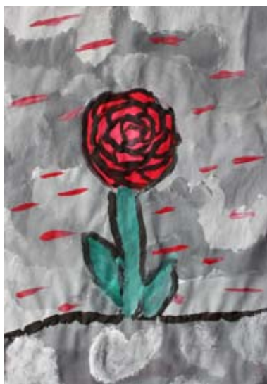
Špela Gavez, 5. a