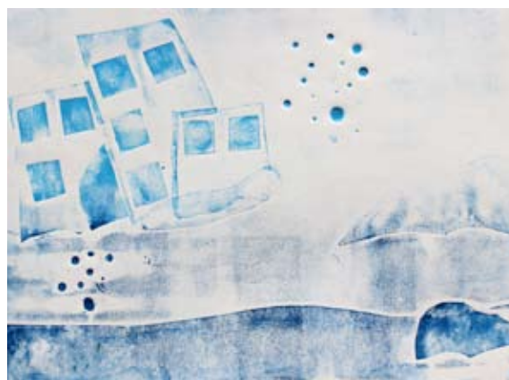
Ema Kovač, 6. b

Naša šola je posebna po tem, da imamo res dobre učitelje. Mogoče bi lahko v naš šolski program dodali še španščino in francoščino.