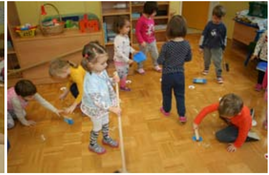
Vzgojiteljice in otroci skupine Lunice