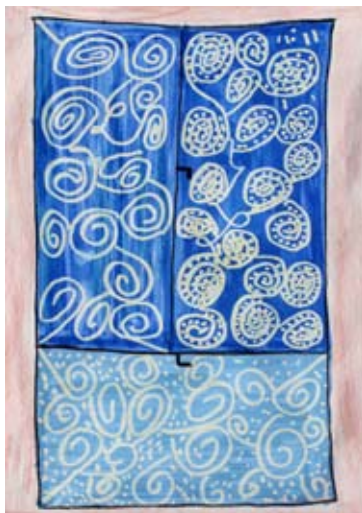
Maja Balaj, 3. a