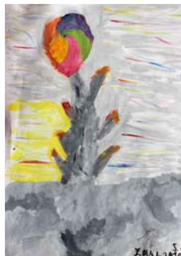
Zoja Lorber, 5. a

V letu 2017 praznujemo 260-letnico organiziranega šolstva v Voličini. Na 7. prireditvi v sklopu praznovanj, ki je bila 19. 9. 2017, nas je obiskal in bil slavnostni govornik predsednik Republike Slovenije Borut Pahor. Predsednikova prisotnost daje znanju, veščinam in vrednotam, ki jih goji šola, poseben pomen in težo. OŠ Voličina ima v začetku šolskega leta vpisanih 230 učencev v 13 oddelkih, od tega se 2 učenki izobražujeta na domu. Organizirane imamo 4 skupine podaljšanega bivanja v skupnem obsegu 66 ur na teden. Vrtec v začetku septembra obiskuje 81 otrok, ki so razporejeni v 5 skupin. S ponosom ponovno poudarjamo, da je izdajanje šolskega glasila Šolarček posebnost šole v Voličini. Zbrana sredstva sponzorjev in staršev donatorjev šola nameni nakupu igrač, didaktičnih pripomočkov, učil in knjig. Za darovana sredstva se najlepše zahvaljujemo. Strokovni delavci se bomo še naprej trudili, da bodo dejavnosti in pouk potekali kakovostno. Ravnatelj mag. Anton Goznik.