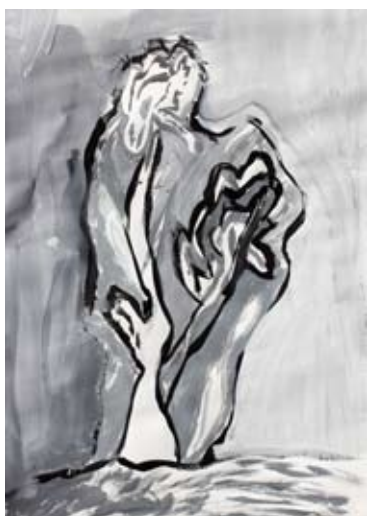
Žak Urnaut, 5. a