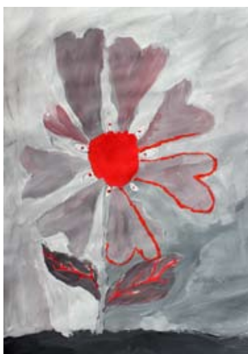
Ajda Strmčnik Kranvogel, 5. a