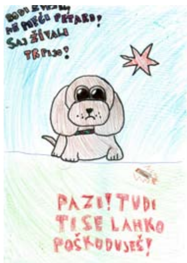
Nika Vnučec Hlupić, 5. a