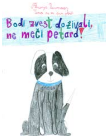
Ajda Strmčnik Kranvogel, 5. a