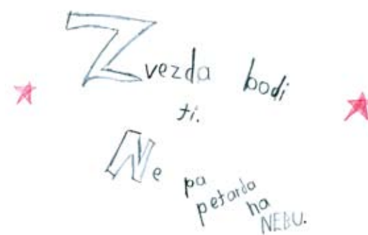
Nil Škerbot, 5. a