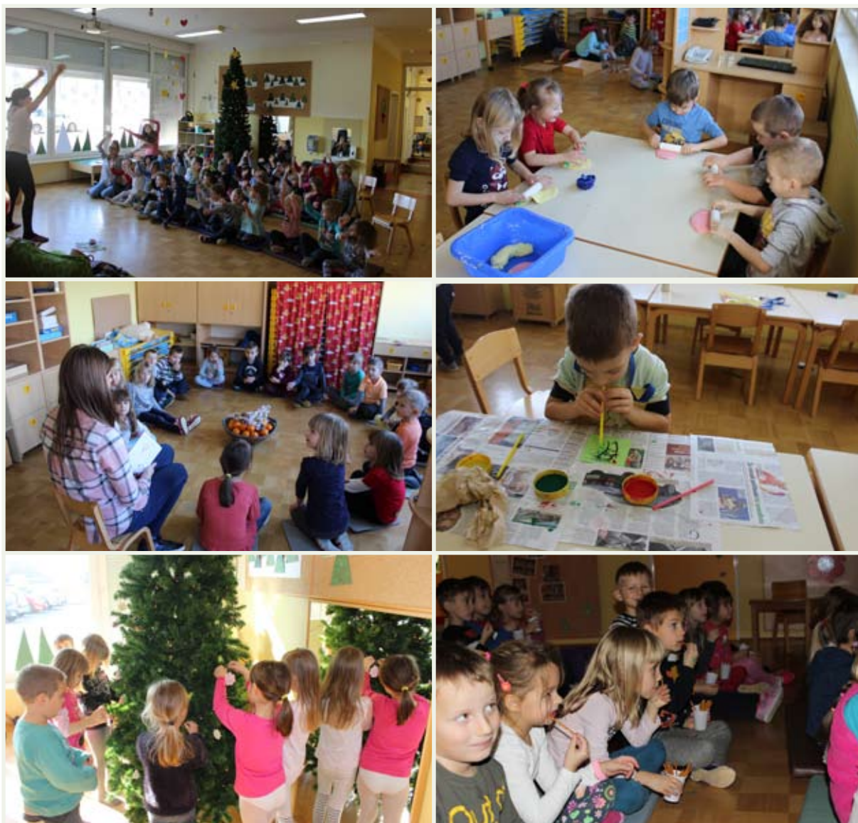
Sončki z vzgojiteljicama

Želimo vam miren božič in srečno novo leto.