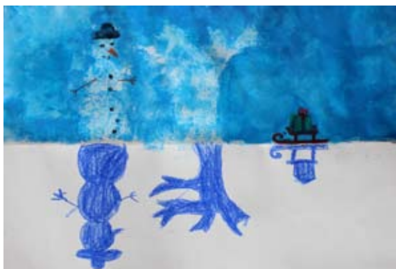
Neža Štruc, 4. b