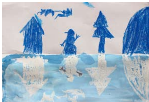
Tai Kmetič, 4. a