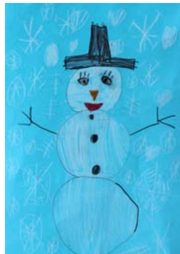
Iris Kramberger, 2. a