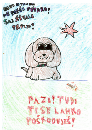
Nika Vnučec Hlupić, 5. a