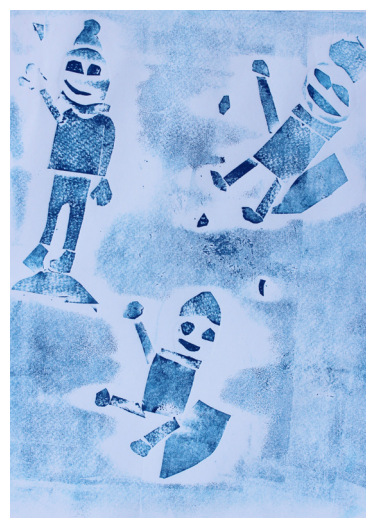
Neja Ditner, 3. b

V letu 2017 praznujemo 260-letnico organiziranega šolstva v Voličini. Na 7. prireditvi v sklopu praznovanj, ki je bila 19. 9. 2017, nas je obiskal in bil slavnostni govornik predsednik Republike Slovenije Borut Pahor. Predsednikova prisotnost daje znanju, veščinam in vrednotam, ki jih goji šola, poseben pomen in težo. OŠ Voličina ima v začetku šolskega leta vpisanih 230 učencev v 13 oddelkih, od tega se 2 učenci izobražujeta na domu. Organizirane imamo 4 skupine podaljšanega bivanja v skupnem obsegu 66 ur na teden. Vrtec v začetku septembra obiskuje 81 otrok, ki so razporejeni v 5 skupin. S ponosom ponovno poudarjamo, da je izdajanje šolskega glasila Šolarček posebnost šole v Voličini. Zbrana sredstva sponzorjev in staršev donatorjev šola nameni nakupu igračk, didaktičnih pripomočkov, učil in knjig. Za darovana sredstva se najlepše zahvaljujemo. Strokovni delavci se bomo še naprej trudili, da bodo dejavnosti in pouk potekali kakovostno. Ravnatelj mag. Anton Goznik.