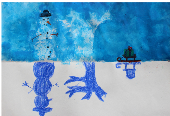
Neža Štruc, 4. b