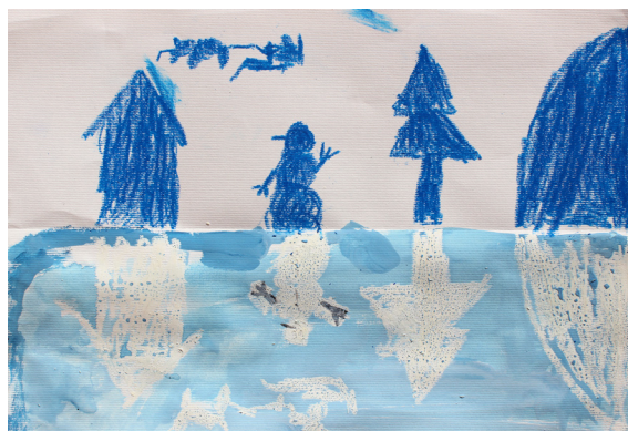
Tai Kmetič, 4. a