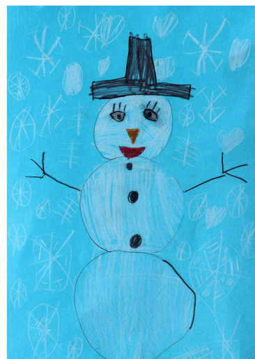
Iris Kramberger, 2. a