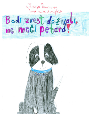
Ajda Strmčnik Kranvogel, 5. a