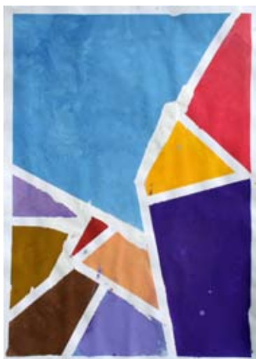
Primož Petko in Blaž Sekol, 7. a