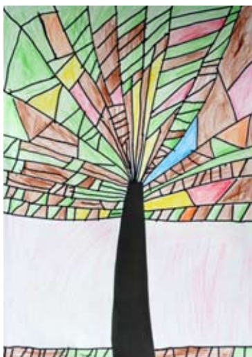
Urška Gomboc, 3. b