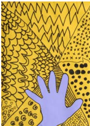
Lija Kramberger, 1. a