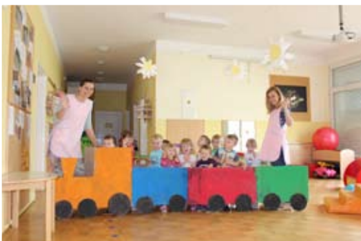
Z vlakcem Luko na pot.