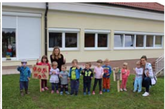
Naj bo svet pisan, lep, bogat ...