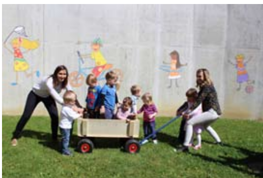
A bo šlo?