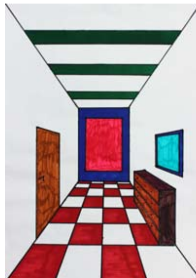
Aljaž Goznik, 8. a