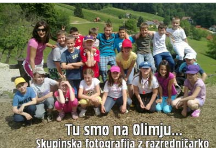
Tu smo na Olimju... Skupinska fotografija z razredničarko

Leta 2012 smo postali šestičarji in začelo se je