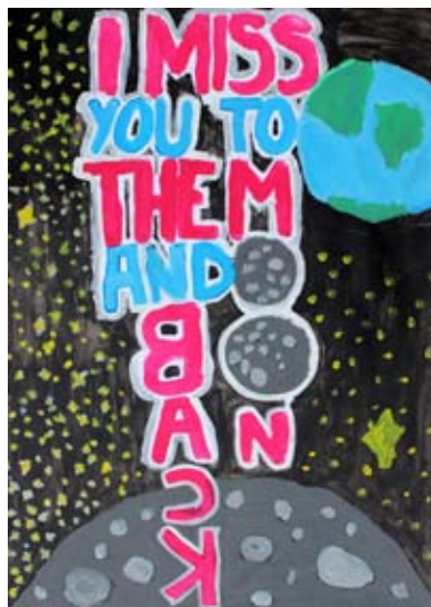
Teja Pfajfar, 8. b