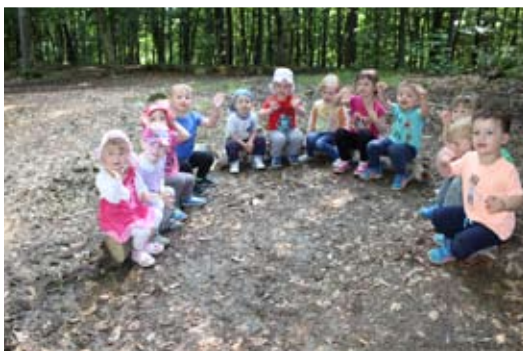
Dejavnosti v gozdu.