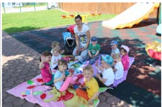
Malica na prostem.