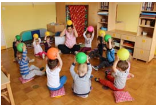
Igre z žogo.