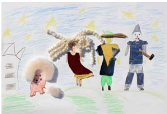
Klara Petek, 4. a