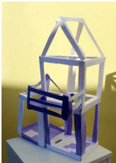
Sara Rojs, 5. a