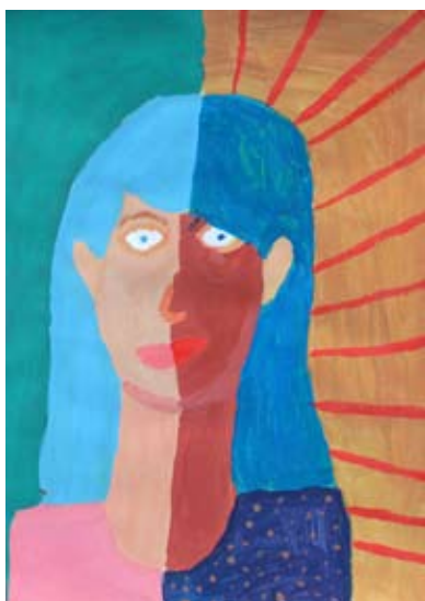
Natalija Krajnc, 9. a