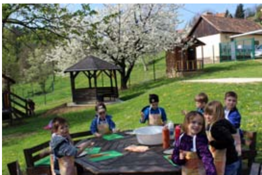
Slikanje cvetoče češnje.