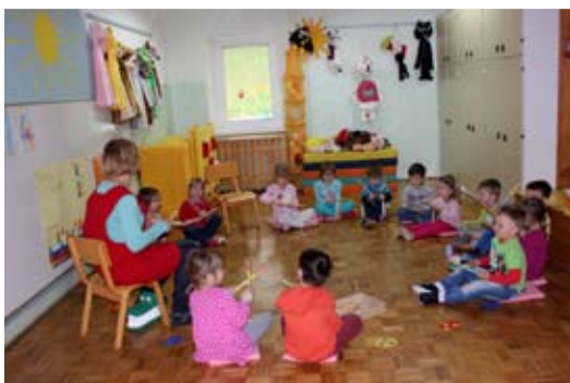
Igranje na lesene palčke.