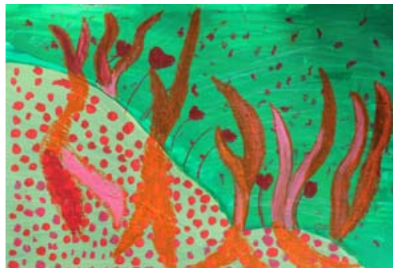
Živa Sužnik, 6. a

Ko se pomlad prebujati začne, zvončki na plano pokukajo že. Zajčki po polju veselo drvijjo in se pomladi veselijo.