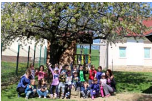
Druženje pod našo češnjo.

dno manj, smo morali šteti nazaj – od pet do nič. Mini maturantje smo se skupaj s prijatelji iz skupine Sončki udeležili plavalnega tečaja v Termah Ptuj. Plavalni tečaj je trajal pet dni. Pohvalimo se lahko, da že vsi znamo narediti raketo, nekateri izmed nas pa že plavamo brez rokavčkov. Da se ne bi potepali samo mi, kdaj pa kdaj v vrtec povabimo tudi kakšen poseben obisk. Ta mesec so nas obiskale vzgojiteljice iz vrtca Voličina, ki so nam zaigrale lutkovno predstavo z naslovom Lisičja zgodba. Tako kot lisička v lutkovni predstavi, si tudi mi že nestrpno želimo v šolo. Bodoči šolarji že pridno rešujemo Cici Veselošolske naloge, mlajši otroci pa z veseljem pripovedujemo pravljice svojim radovednim prijateljem.