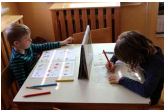
Reševanje Cici Veselošolskih nalog