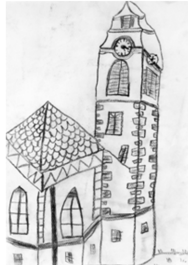
Tinkara Štruc, 4. a