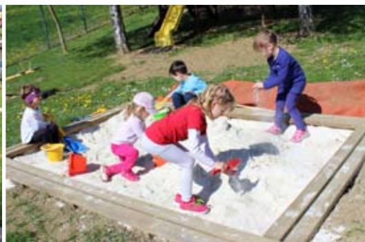
Igra v peskovniku