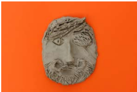
Hana Pivljakovič, 7. b