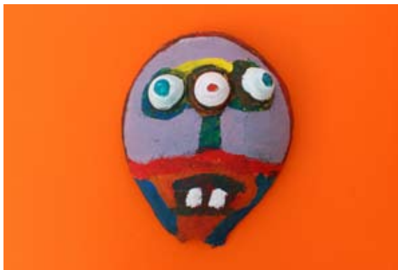
Žan Breznik, 3. a