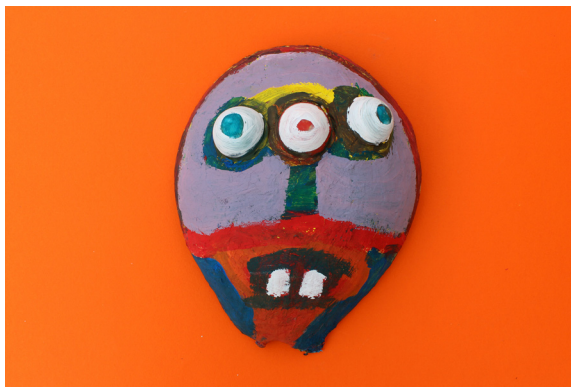
Žan Breznik, 3. a