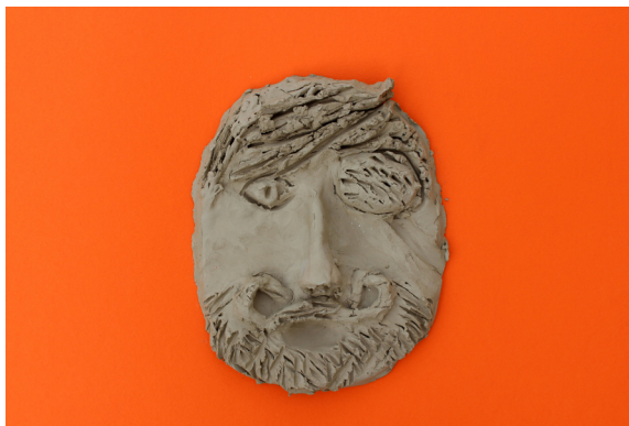
Hana Pivljakovič, 7. b