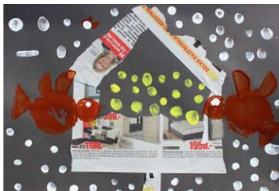
Timotej Kocbek, 1. b