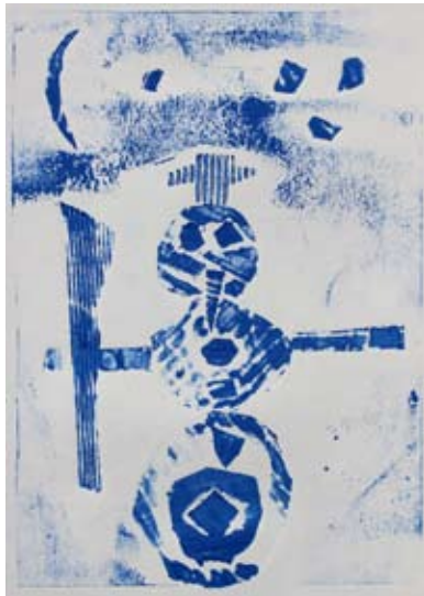
Rok Belčič, 3. a