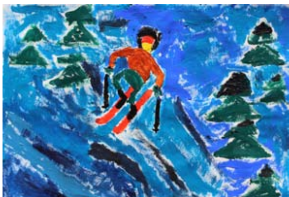
Blaž Sekol, 5. a