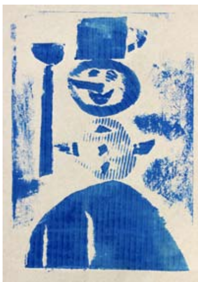
Filip Šinjur, 3. a