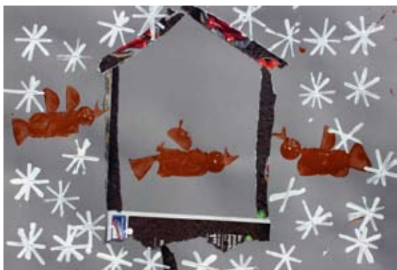
Saška Gavez, 1. a