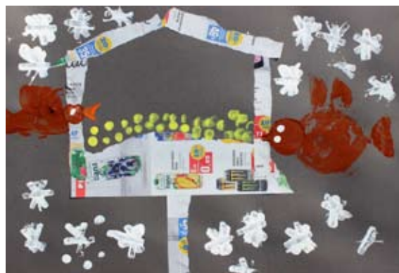
Vita Munda, 1. b