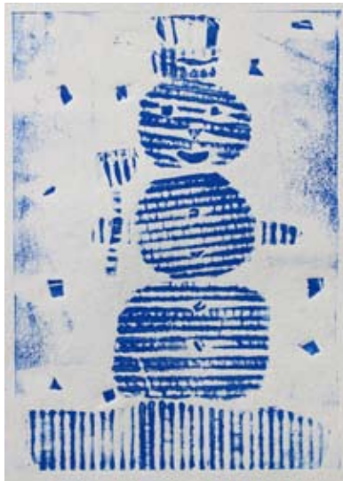
Špela Gavez, 3. a