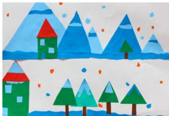
Klara Herga, 5. a

je dragulj namestila v skalo. Dragulj je zažarel in mlaka je postala spet čista. Imele so se lepo.