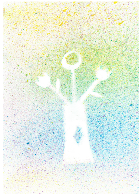
Lara Šrimpf, 3. a