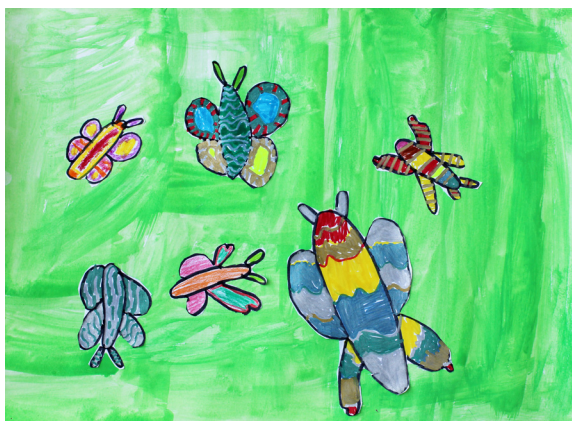
Aljaž Sužnik, 2. a