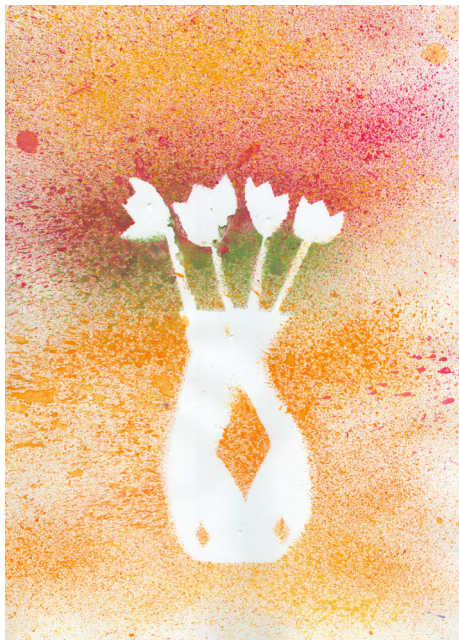
Neja Lašič, 3. a