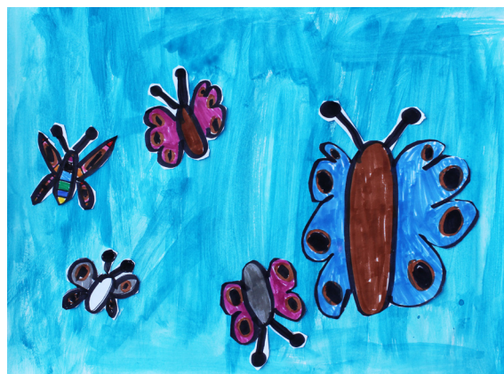
Gašper Urbanc, 2. a