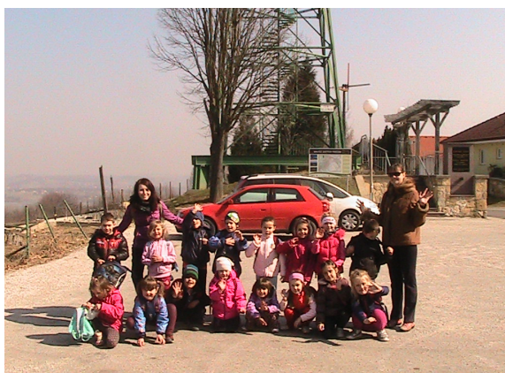
Pohod na Zavrh