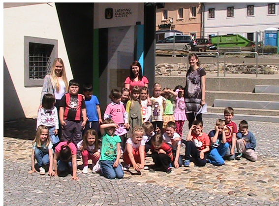
V lutkovnem gledališču

Prišel je mesec maj in Sončki že močno sijemo. Toplo nam je v srčkah, ker se imamo zelo radi. Naš nasmeh na obrazih pa naj vam pove, da nam je lepo in da se radi igramo s prijatelji. V vrtcu pa se samo ne igramo, ampak tudi se pridno pripravljamo na šolo. V tem mesecu smo imeli Ciciveselošolski dan in smo reševali naloge, kot pravi šolarji. Naloge je pregledal Modri medvedek in nam nato poslal pohvale. Imeli smo tudi Eko teden, v katerem smo se veliko pogovarjali o smeteh in pravilnem ločevanju odpadkov. Na obisk smo povabili Saubermacher-ja, ki nam je pokazal njihovo vozilo in različne zabojnike za odpadke. Odpravili smo se tudi na pohod do Završkega stolpa in se najpogumnejši povzpeli nanj. Z vrha stolpa smo si ogledali okolico in poiskali naš vrtec. V tem mesecu smo se z avtobusom odpeljali v Maribor v lutkovno gledališče, kjer smo si ogledali lutkovno predstavo Sneguljčica. Pred nami pa je Gibalčkov teden, v katerem se bomo veliko gibali, spoznavali različne športe in si priredili športni dan. Tudi vam svetujemo, da se odpravite na svež zrak in poskrbite za svoje telo. »Zdravo z naravo!«