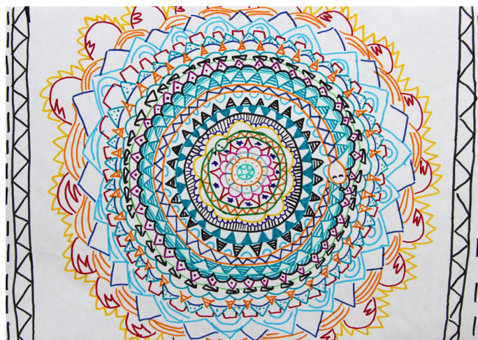
Nikita Fras, 7. b