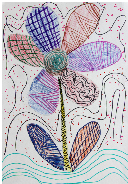
Larisa Iljevec, 5. a

In slej kot prej tudi teta Polly. Obrnila se je proti Tomu in mu rekla: »Oh, iskala sem te. Veš, dobili smo novo koso in bi koristilo, če bi jo preizkusil na travi pred mojo hišo.« Tom je pogledal v sonce, ocenil trajanje in ugotovil, da bo delal v največji vročini. Prispel je k hiši tete Polly in se ozrl. Ta je bogata. Ima veliko dvorišče in visoko travo. Zato mu dela na to