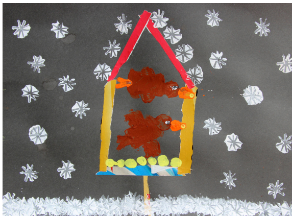
Neja Ornik, 1. a