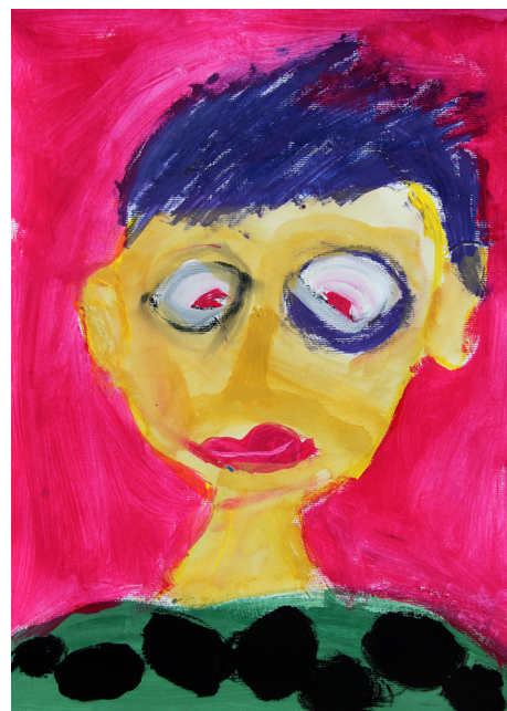
Jure Jug, 5. a