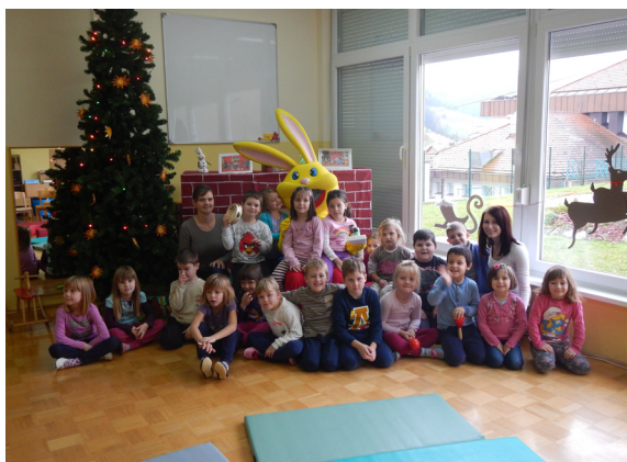
Obiskal nas je Sparky.