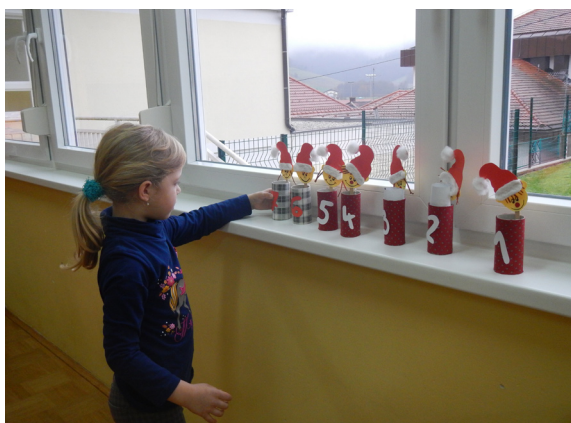
Postavitev adventnega koledarja.