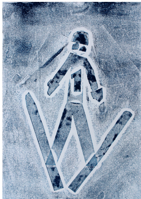
Ambrož Rukav, 3. a