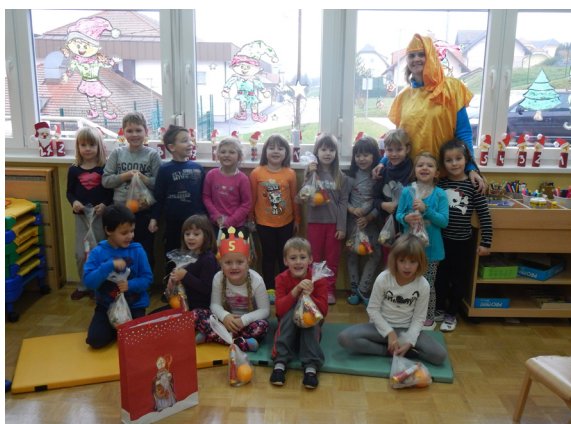
Škrat nam je prinesel miklavževa darilca.