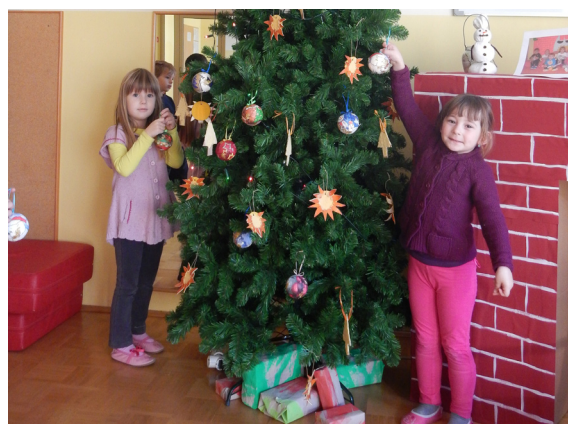
Obešanje okraskov na smreko.