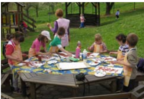
Slika 1: Zelo radi slikamo s čopiči in odločili smo se, da cvetočo češnjo slikamo prostem.