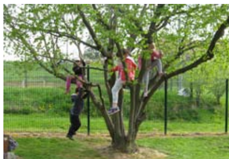
Slika 4: Na igrišču imamo najraje lesko, po kateri vsi radi plezamo in preizkušamo moči naših mišic. In veste, kaj ugotovljamo? Ha ha, da smo vsak dan večji in močnejši.