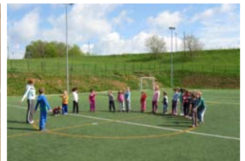
Slika 5: Najprej se je treba ogreti in razmigiati.