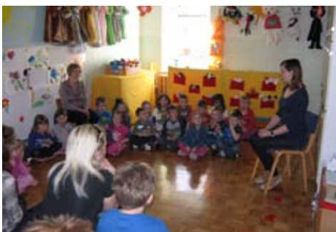
Slika 3: Mamicam smo zapeli še nekaj pesmic in jim z deklamacijo Prošnja povedali, da jih imamo zelo radi. V zahvalo smo jim poklonili rožico in voščilnico.