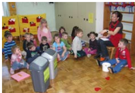
Slika 2: Da bo ločevanje lažje, smo koše označili in jih polepšali.