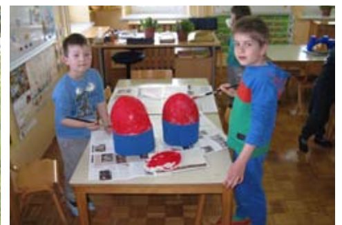
Slika 7: Če nam je v zahvalo kaj prinesel, vam še sporočimo.