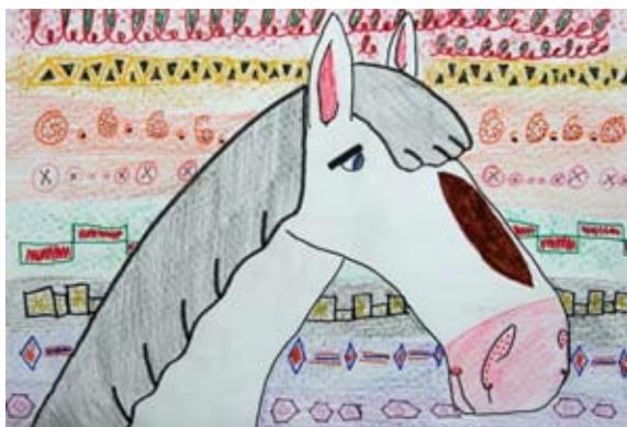
Ajla Ana Egghart, 5. a