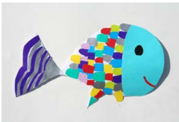
Tinkara Štruc, 2. a