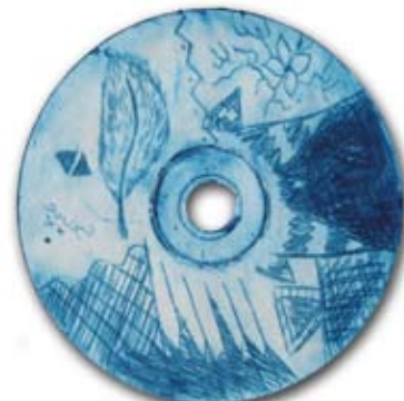
Sara Toplak, 8. a