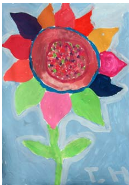
Tadej Hegedič, 5. b