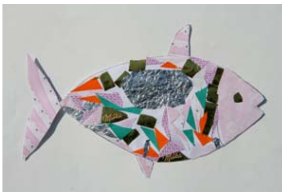
Neja Lašič, 2. a