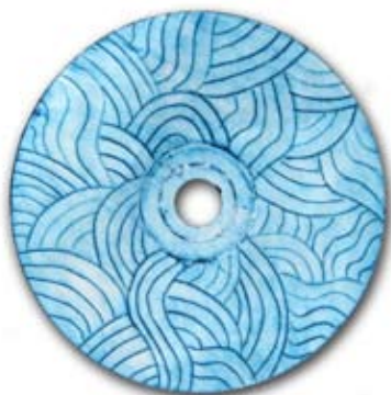
Nadja Fras, 8. b