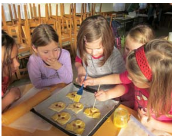
Peka piškotov pred prazniki