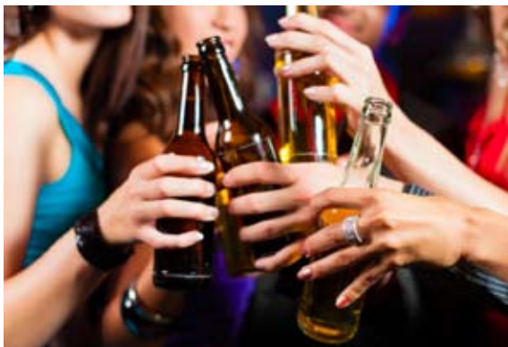
Alkoholizem, zlo sodobnega časa

Posledice pitja alkohola so lahko telesne, duševne in družbene oziroma socialne. Alkohol je za telo strup in neposredno deluje na organele. Navadno ima človek naslednji dan po prekomernem uživanju alkohola