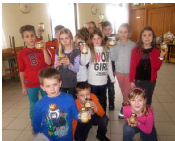
Pripravili smo čebulni sirup

1 čebulo olupite (ne pozabite, da olupke lahko uporabite za zdrav in naraven način barvanja pirhov, o tem vam bodo znale svetovati vaše babice). Narežite jo na ne preveč tanke kolobarje. Kolobarje dajte v manjšo stekleničko. Na čebulo dajte žlico medu. Stekleničko zaprite. Postavite jo npr. na polico v kuhinji. V steklenički se kmalu začne nabirati sirup. Čebula naj stoji tako 1 dan. Naslednji dan tekočino precedite (to je sirup) in jo dajte v hladilnik. Sirup lahko hranite v hladilniku do 3 dni, če ga seveda prej ne spijete. Predlagam vam, da si sproti pripravljate svežega.