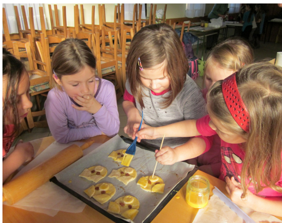
Peka piškotov pred prazniki