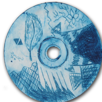
Sara Toplak, 8. a