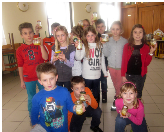
Pripravili smo čebulni sirup

1 čebulo olupite (ne pozabite, da olupke lahko uporabite za zdrav in naraven način barvanja pirhov, o tem vam bodo znale svetovati vaše babice). Narežite jo na ne preveč tanke kolobarje. Kolobarje dajte v manjšo stekleničko. Na čebulo dajte žlico medu. Stekleničko zaprite. Postavite jo npr. na polico v kuhinji. V steklenički se kmalu začne nabirati sirup. Čebula naj stoji tako 1 dan. Naslednji dan tekočino precedite (to je sirup) in jo dajte v hladilnik. Sirup lahko hranite v hladilniku do 3 dni, če ga seveda prej ne spijete. Predlagam vam, da si sproti pripravljate svežega.