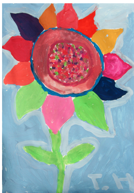
Tadej Hegedič, 5. b