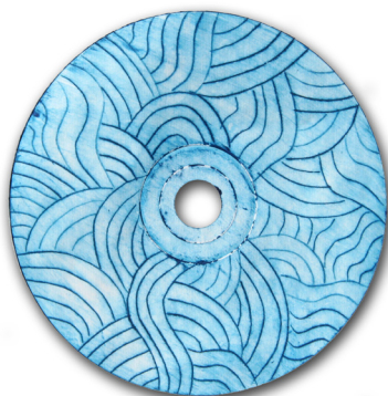
Nadja Fras, 8. b