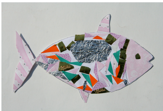
Neja Lašič, 2. a