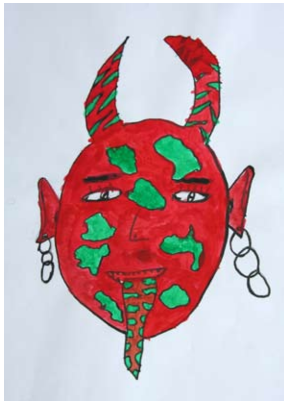
Nik Belčič, 6. b