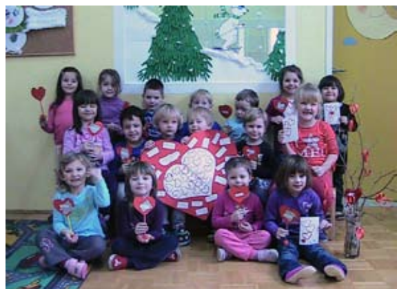
Srček za prijatelja

naš velik vzornik in v naših malih srčkih velik junak. Življenje brez prijateljev je pusto in žalostno. Tudi mi smo žalostni, kadar naših prijateljev ni v vrtcu. Zato smo se tik pred valentinovim, spomnili tudi na prijatelja, ki ga lahko razveselimo, saj ga imamo radi in mu kaj lepega podarimo. Izdelali smo prav posebej velik srček za naše prijatelje in v njem strnili vsak svojo lepo misel, ki jo podarjamo prijatelju.