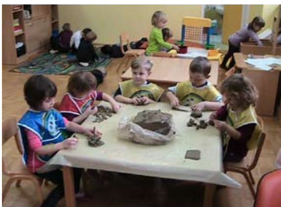
Ustvarjamo iz gline.

Poleg različnih tekočin, pa zelo radi spreminjamo in oblikujemo tudi druge mase. To so oblikovalni pesek, playmais masa, plastelin, das masa, glina, slano testo in še drugi naravni materiali. Iz njih nastajajo najrazličnejše umetnine in skulpture, predvsem pa je pomembno, da se zelo zabavamo in uživamo. Naše izdelke najprej razstavimo, kasneje pa si jih odnesemo tudi domov.