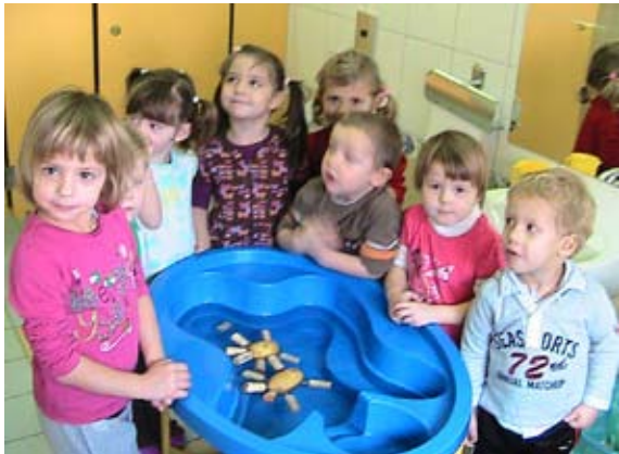
Ali krompir plava na vodi? Naš plava!

Zima nam dolgo ni hotela pokazati snega, potem pa nam je kar na enkrat natresla snega in nam nakopala še ledene nevšečnosti. Še sreča, da smo mi bili na toplem in eksperimentirali. To pomeni, da smo izvajali poskuse z vodo. Zanimalo nas je veliko stvari, predvsem pa kaj plava na vodi in kaj potone, kako se mešajo med seboj nekatere tekočine in topnost, kako se tekočine spremenijo ob nizki temperaturi in še veliko podobnih eksperimentov z vodo.