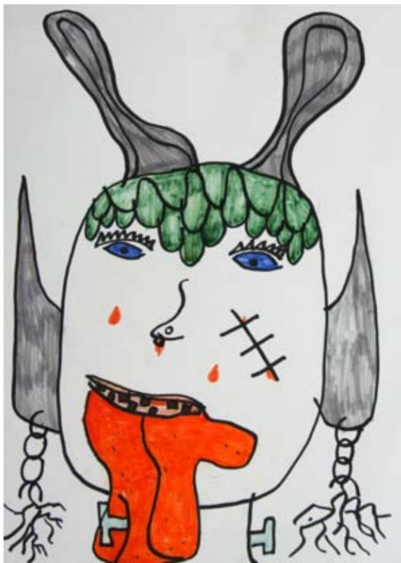
Amadej Papež, 6. b