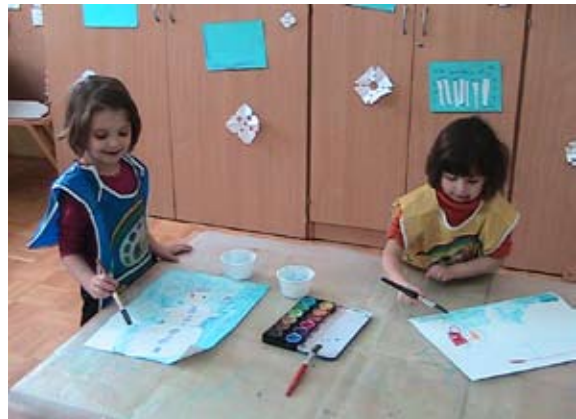
Naši krasni snežaki z voščenko in vodenimi barvami