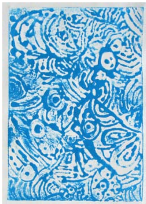
Kaja Hubernik, 5. b