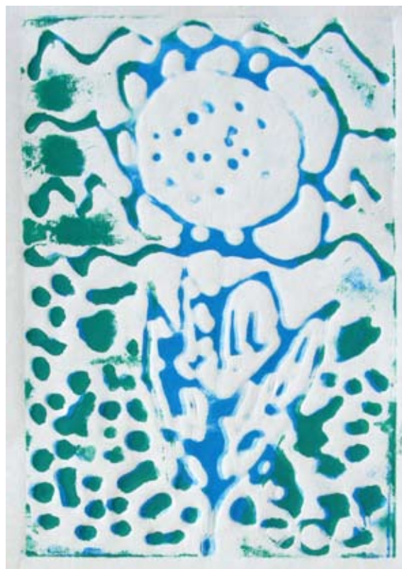
Sergeja Hameršak, 5. b