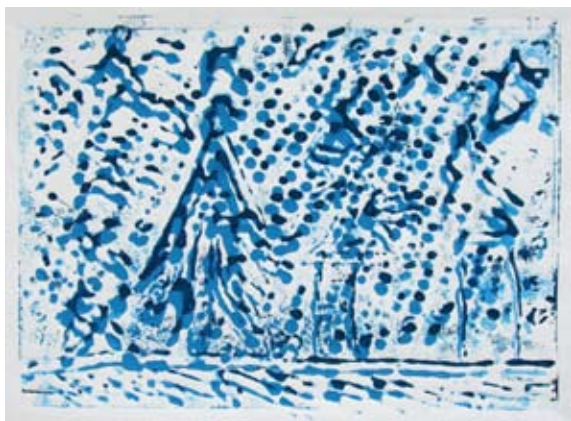
Doroteja Potrč, 5. a

alkoholnimi flomastri in nisem risala po zidu, ampak po parketu, a vseeno so se moji in njegovi starši zelo jezili.