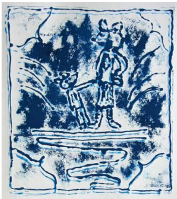
Alja Sever, 5. a