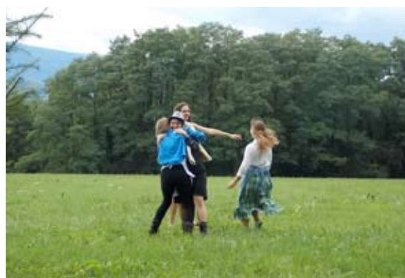
Utrinki s snemanja prizorov

skih prizorov in iz prizorov, ki so jih posneli v okolici Škofijske gimnazije, ter jih predvajali na platnu.