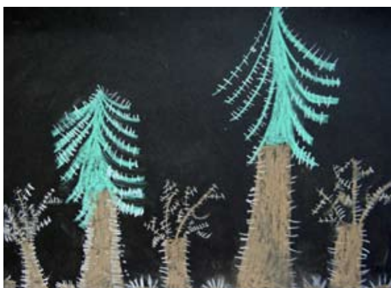
Lara Šrimpf, 2. a