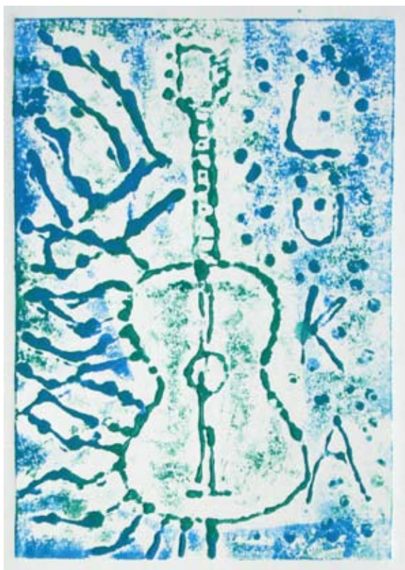
Luka Horvat, 5. b