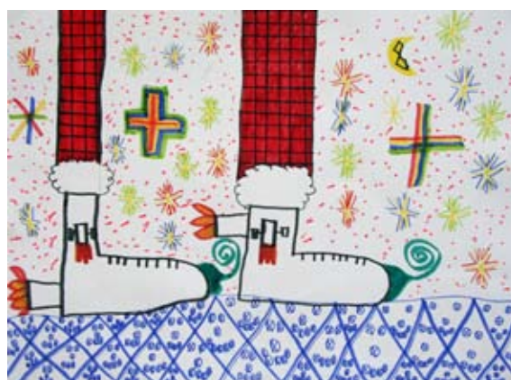
Blaž Kurnik, 5. a