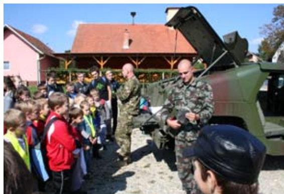
Vojska se predstavi