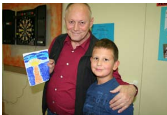
Jure si je našel prijatelja.