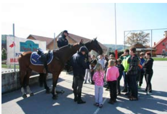
Predstavitev policijske konjenice