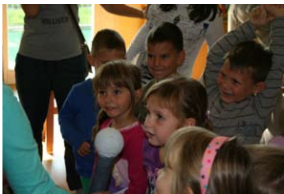
Iskrice v očeh.