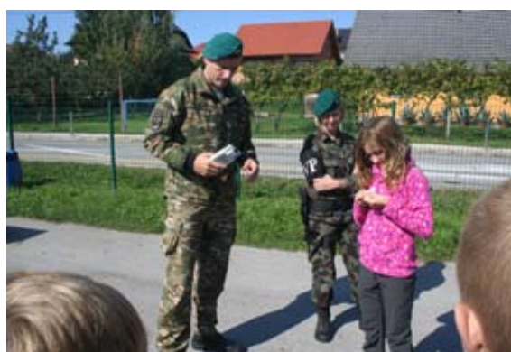
Predstavitev dela vojaške policije