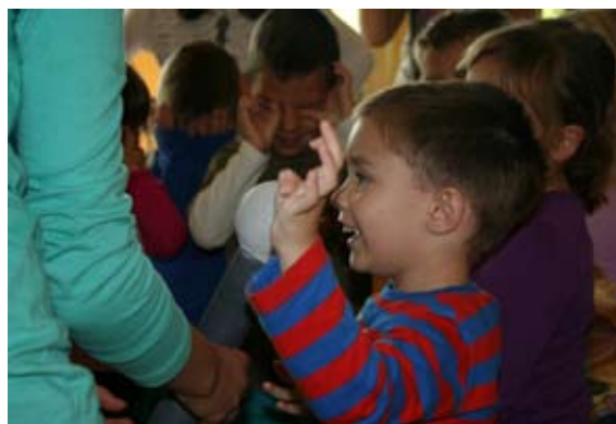
»Le počakajte, ko bom velik bom boljši od Dejana Zavca.«