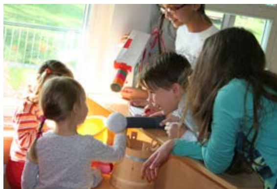
»Ko bom velika, bom kuharica.«