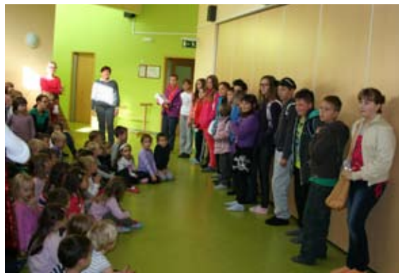
Otroci v vrtcu so nas pričakali s kratkim programom.

Najprej smo se odpravili v vrtec, kjer so nas otroci pričakali s kratkim nastopom, mi pa smo jih povprašali po imenih, letih, najljubših igračah in risankah. Zaupali pa so nam tudi, da bodo, ko odrastejo kuharji, gasilci, boksarji in dreserji konj. Naši učenci so se z njimi prav lepo zabavali. V vrtcu nam je čas še prehitro minil, zato smo se odpravili v center Mravlja. Tam so nas šele bili veseli. Ugotovili smo, da so tam pravi umetniki. Bili so tako spretni! Naši učenci pa prav tako. Šivali so prtičke, izdelovali voščilnice,