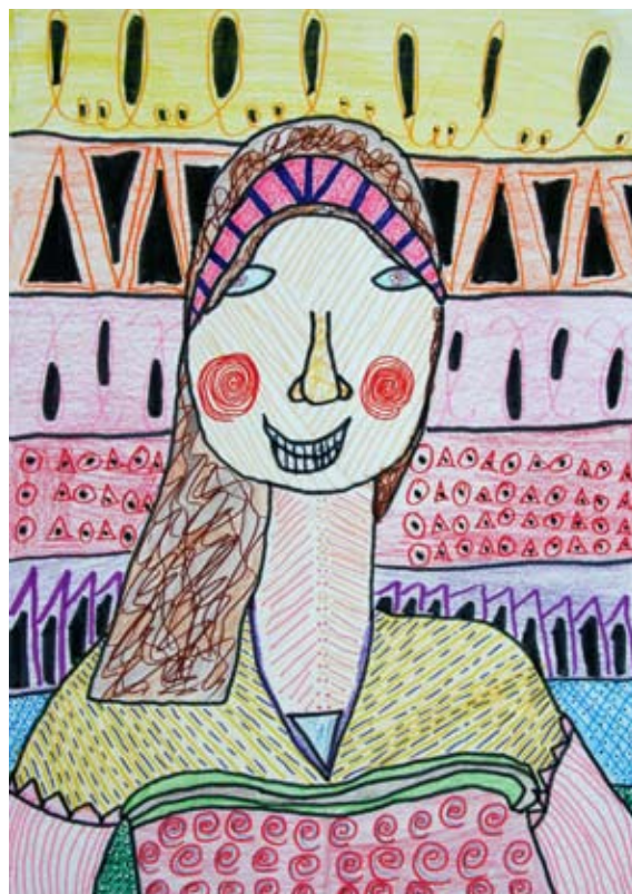
Ajla Ana Egghart, 5. a