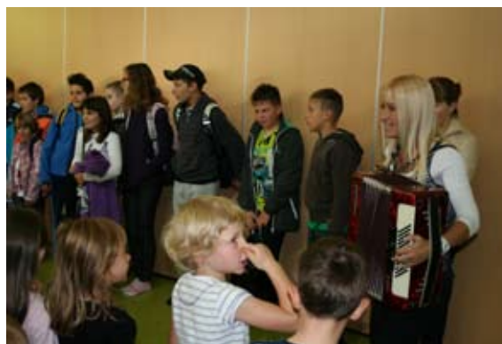
»Uh, kako smrdi!« zanimiva predstavitev pesmi.