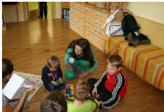
Ime mi je ...