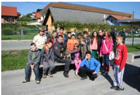
Predstavitev dela policije s službenimi psi