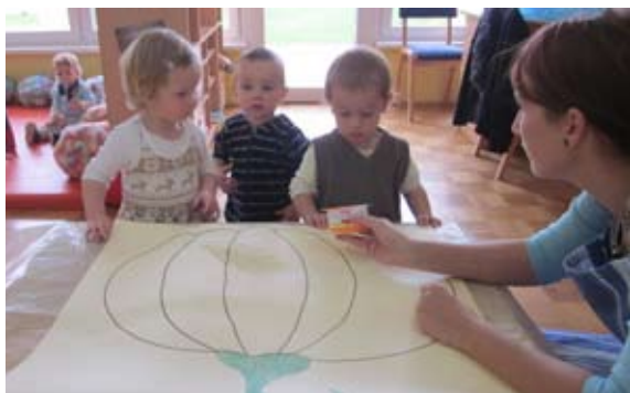
Barvanje buče velikanke

Nekaj plodov smo si šli nabirat kar sami na »Štralek«. Prav ste prebrali, tako majhni, pa gremo že tako daleč. Z nahrbtnikom na rami, saj tudi mi potrebujemo kakšen priboljšek po naporni poti. V naravi nas čaka toliko različnih doživetij, da smo ob prihodu nazaj, po navadi popolnoma izčrpani.