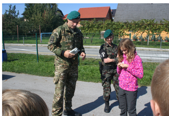
Predstavitev dela vojaške policije