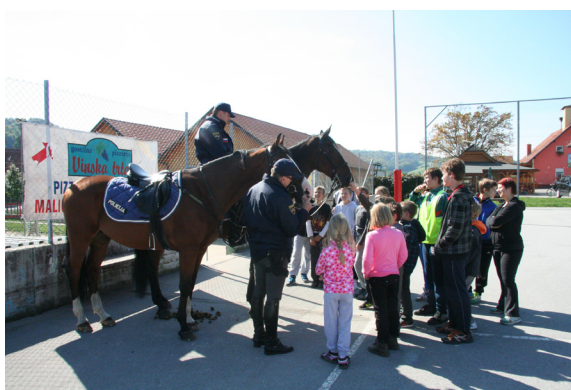
Predstavitev policijske konjenice