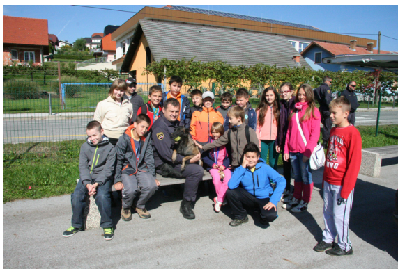
Predstavitev dela policije s službenimi psi