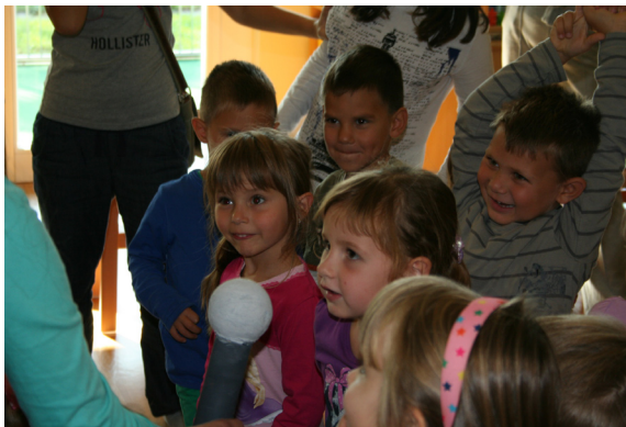
Iskrice v očeh.