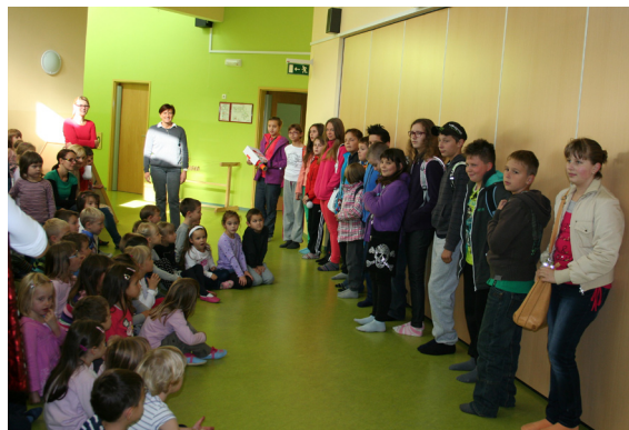
Otroci v vrtcu so nas pričakali s kratkim programom.

Najprej smo se odpravili v vrtec, kjer so nas otroci pričakali s kratkim nastopom, mi pa smo jih povprašali po imenih, letih, najljubših igračah in risankah. Zaupali pa so nam tudi, da bodo, ko odrastejo kuharji, gasilci, boksarji in dreserji konj. Naši učenci so se z njimi prav lepo zabavali. V vrtcu nam je čas še prehitro minil, zato smo se odpravili v center Mravlja. Tam so nas šele bili veseli. Ugotovili smo, da so tam pravi umetniki. Bili so tako spretni! Naši učenci pa prav tako. Šivali so prtičke, izdelovali voščilnice,