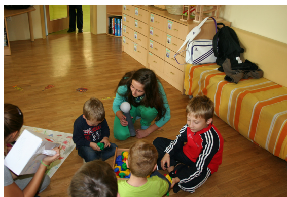
Ime mi je ...