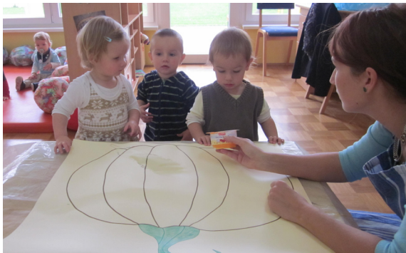
Barvanje buče velikanke

Nekaj plodov smo si šli nabirat kar sami na »Štralek«. Prav ste prebrali, tako majhni, pa gremo že tako daleč. Z nahrbtnikom na rami, saj tudi mi potrebujemo kakšen priboljšek po naporni poti. V naravi nas čaka toliko različnih doživetij, da smo ob prihodu nazaj, po navadi popolnoma izčrpani.