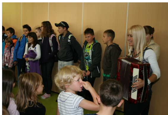
»Uh, kako smrdi!« zanimiva predstavitev pesmi.