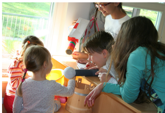
»Ko bom velika, bom kuharica.«