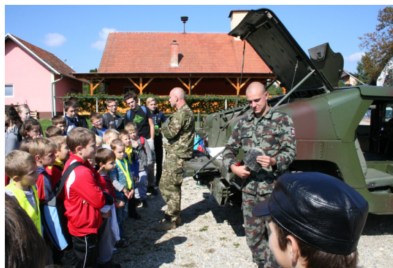
Vojska se predstavi