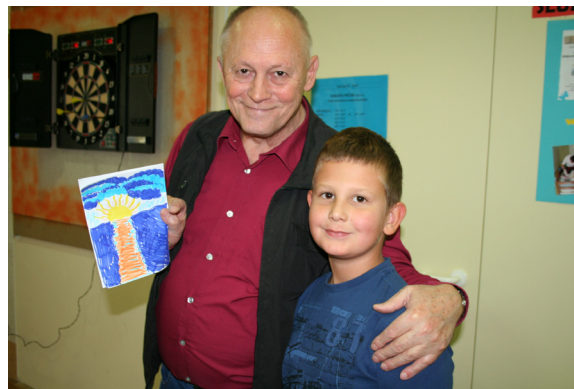
Jure si je našel prijatelja.