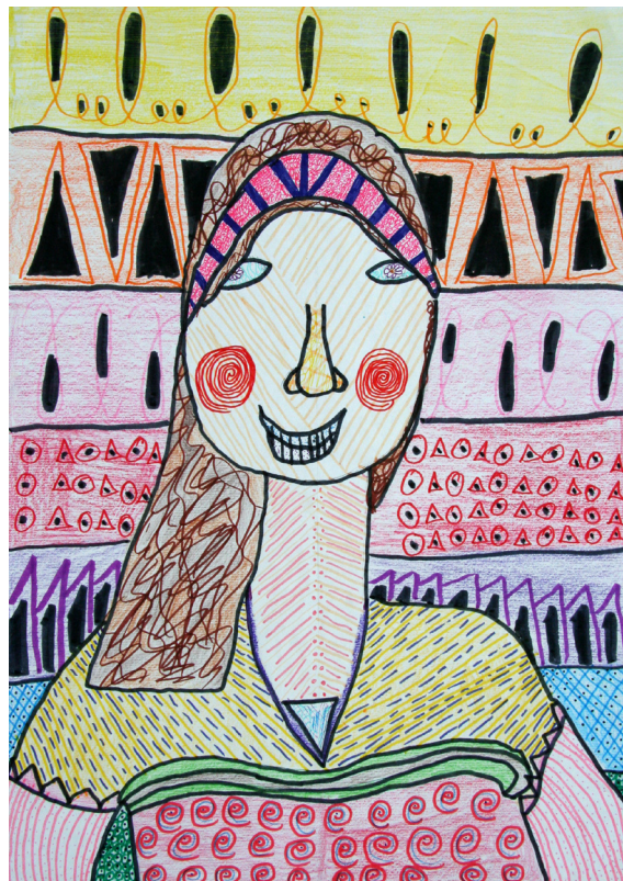
Ajla Ana Egghart, 5. a