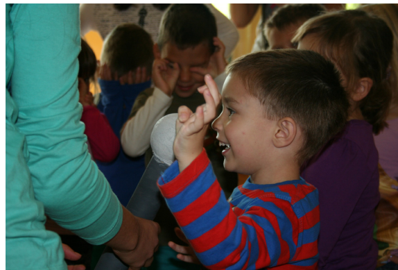
»Le počakajte, ko bom velik bom boljši od Dejana Zavca.«