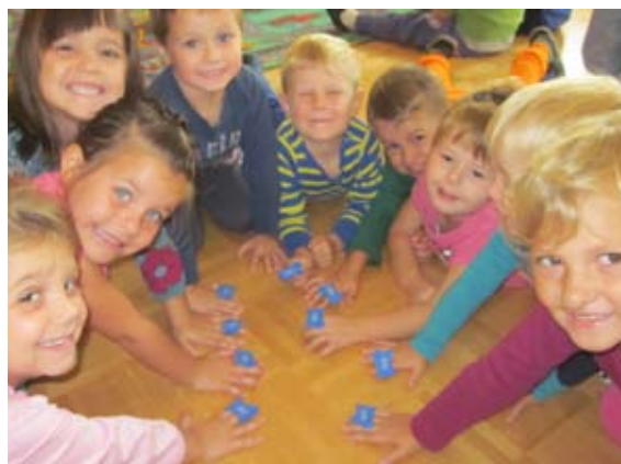
Otroci s slončki na prstu

Da smo mali umetniki, naj bo tudi znano. Kar pogledajte, tako nastajajo naše velike umetnine.