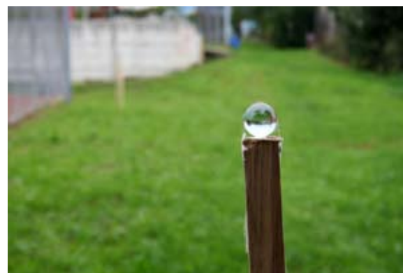
Planet Neptun, ki je pomanjšan na velikost frnikule.