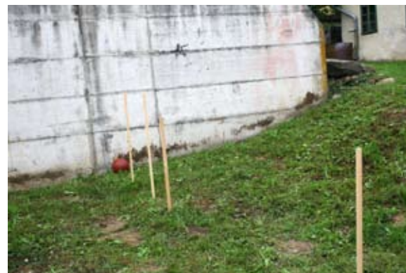
Osončje s košarkarsko žogo kot soncem in pripravami (palicami) za planete.