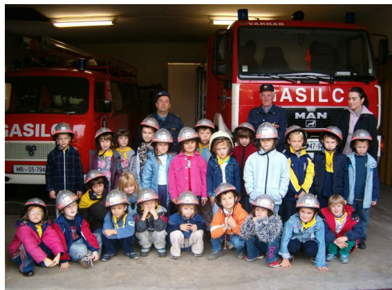
Obisk gasilskega doma.