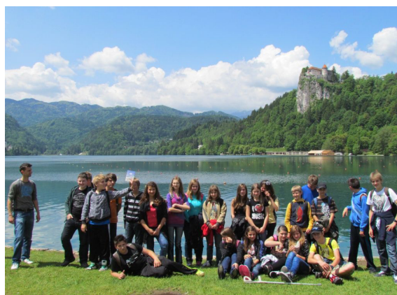
Obisk Bleda v 8. razredu.