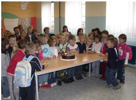
Sprejem v prvi razred.