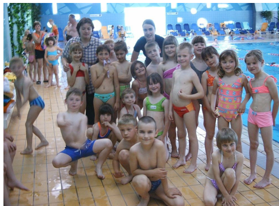
Uživanje v šoli v naravi.