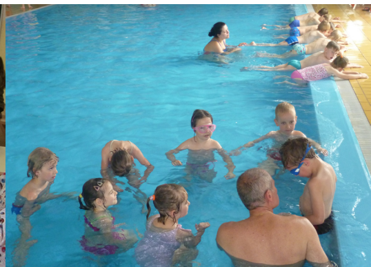
Na plavalnem tečaju, 2. a