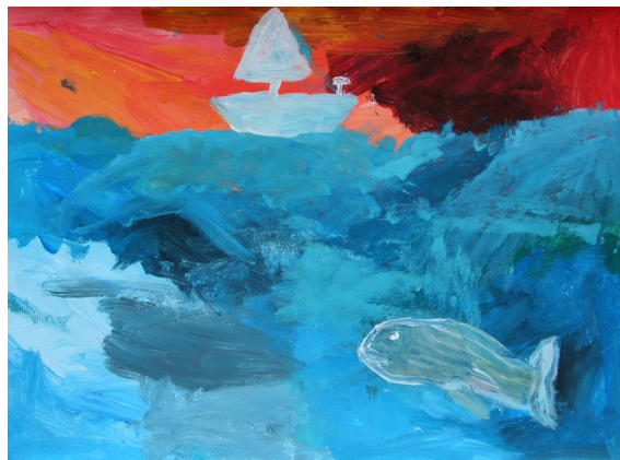
Matic Goznik, 7. a