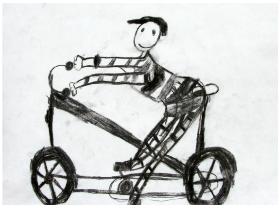
Tino Hamler, 1. a