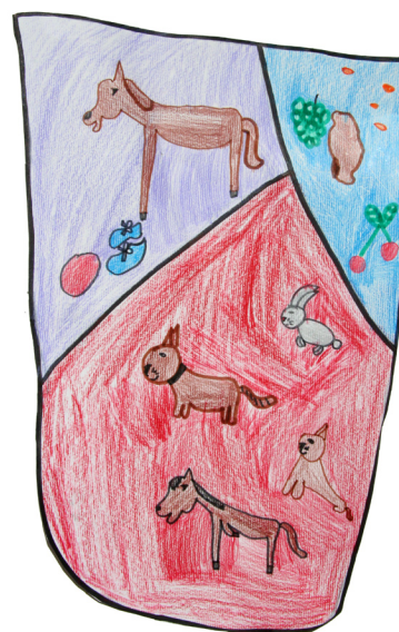
Klara Petko, 1. b