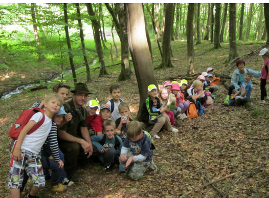
Z lovcem v gozdu, 2. a