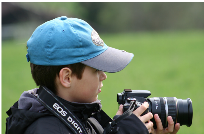
Fotograf, Canon EOS 350D, objektiv 75–300 mm

Posnetka sta nastala v sobotni šoli v skupini, ki se je ukvarjala z digitalno fotografijo.