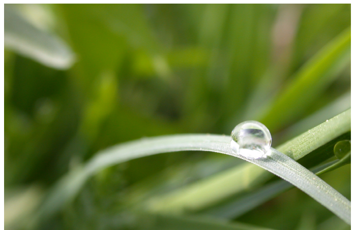
Vodna kapljica, Nikon Coolpix 995