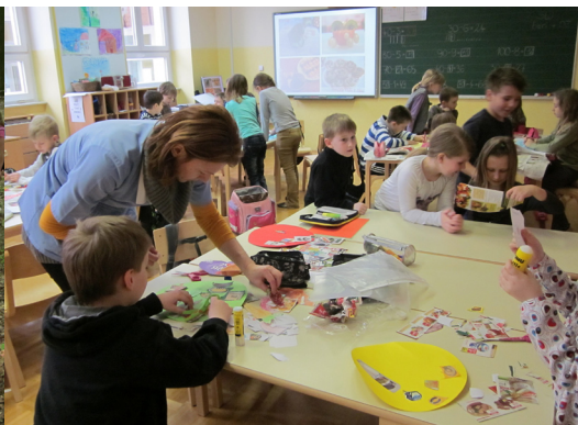
Naravoslovni dan, 2. a