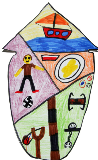
Žiga Šešerko, 1. b