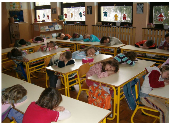
Počitek po napornih urah pouka.