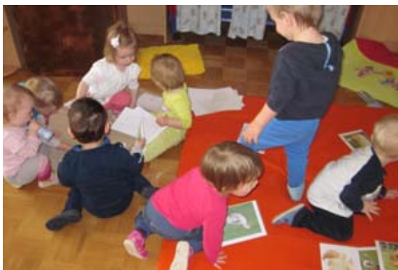
Je kdo videl pujsa?

Tudi živali na kmetiji smo spoznavali skupaj. Naredili smo plakat in se naučili pesmice in prstne igre. Sedaj radi postopamo ob našem izdelku in smo ponosni nanj. Ob fotografijah živali pa se radi tudi pogovarjamo.