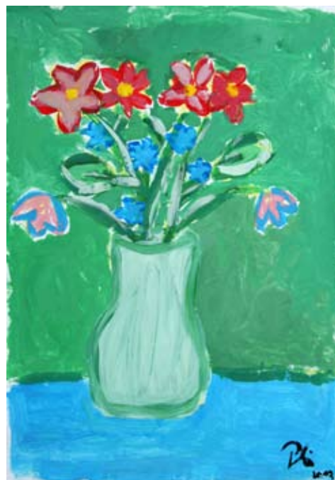
Tina Pliberšek, 5. a