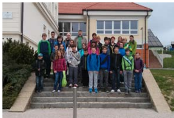
Udeleženci sobotne šole