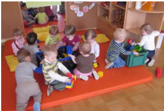
Snežinke v gradbeni akciji

Počnemo veliko zabavnega in pri nas se zmeraj kaj dogaja. Ob številu igrač, ki jih imamo v igralnici, smo vsi veliki navdušenci nad kockami. Naj bodo velike ali majhne, iz njih znamo zgraditi marsikatero stvar. Seveda vemo, da skupaj zmoremo več.