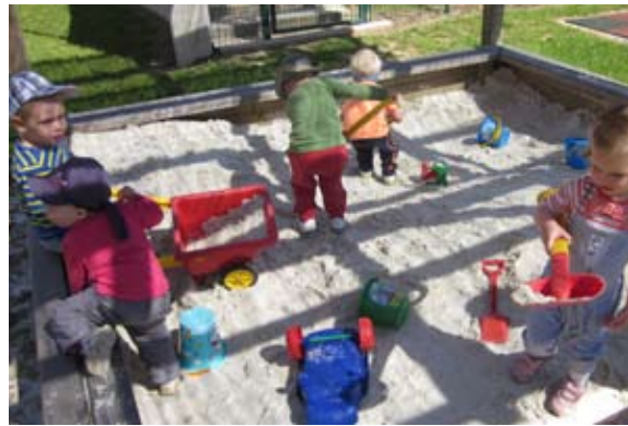
V peskovniku nam ni nikoli dolgčas

Mamice, da ne boste mislile, da mi ne znamo vrtnariti, tako kot ve to počnete v tem času. Posejali smo lastni korenček in sedaj ga pridno zalivamo. Vsak dan pogledamo, ali je kakšen že pokukal na svetlo. Posejali ga nismo kar tako, komaj čakamo, da ga pojemo. Mogoče bo kakšen ostal tudi za zajčke.