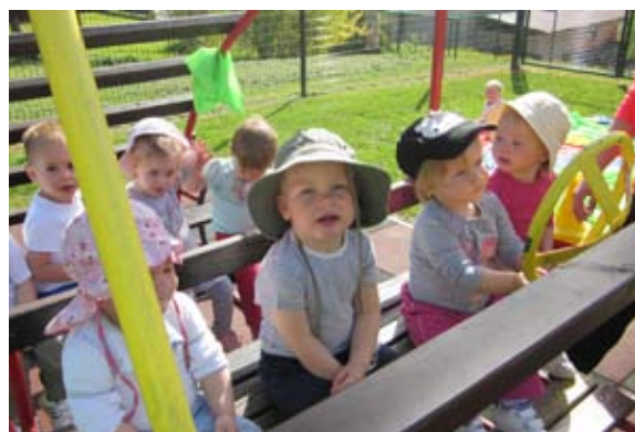
Kje je že živalski vrt?

Ker počnemo toliko stvari, si zaslužimo tudi izlet. Z našim avtomobilom smo bili že marsikje. Pot in voznika izberemo kar skupaj. Nazadnje smo bili v živalskem vrtu? Ker se ravnokar odpravljamo novim dogodivščinam naproti, vam kličemo nasvidenje.