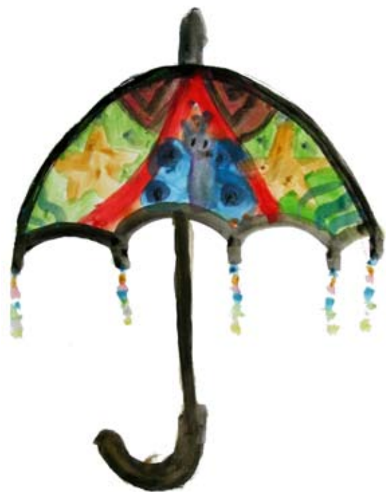
Tinkara Štruc, 1. a