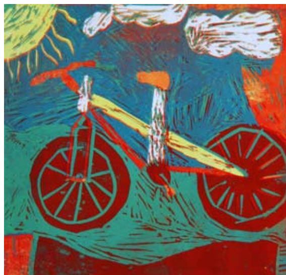
Aneja Onič, 7. a