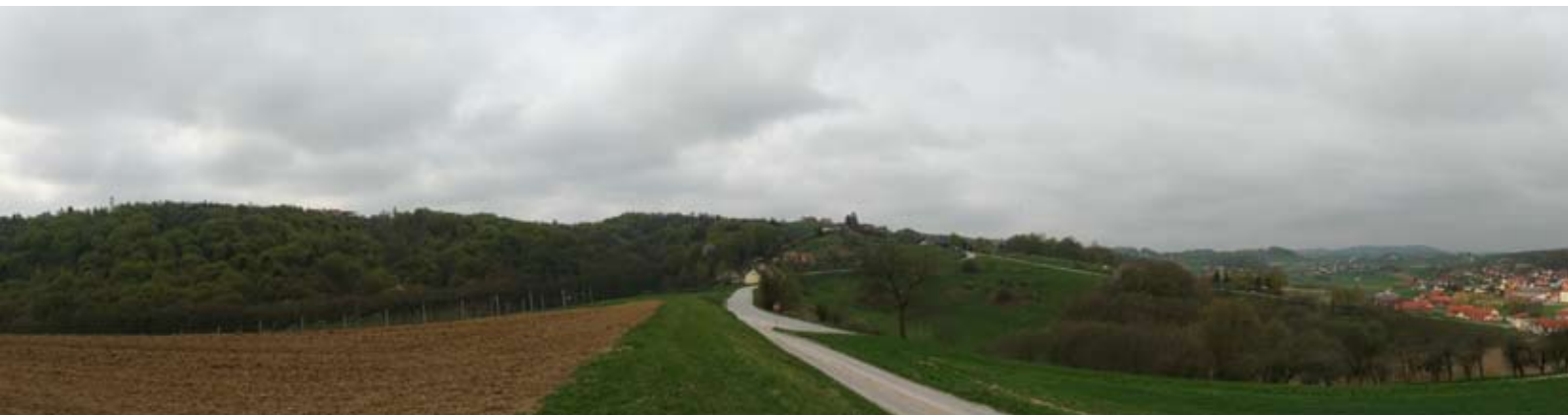
Panoramska fotografija s pogledom na Voličino je nastala v okviru sobotne šole pri skupini, ki se je ukvarjala z digitalno fotografijo.