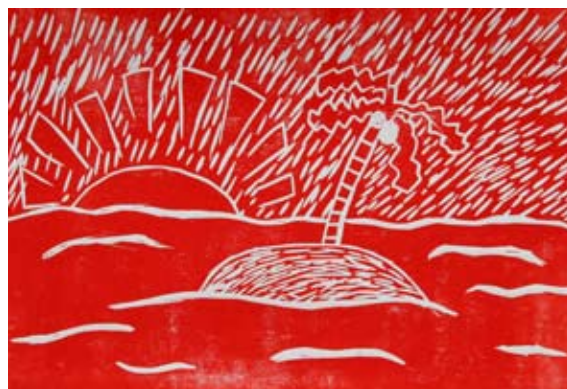
Tina Pliberšek, 5. a