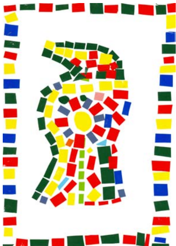
Sergeja Hamersak, 4. b