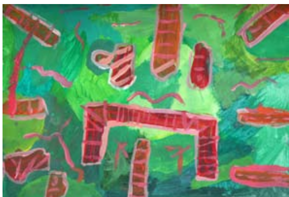
Miha Dobaja, 7. a

Ko mi mama zvečer poljubček poda, skotalim se v vrečo sna.