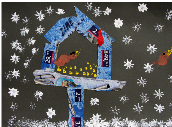
VITAN ŠUMAN, 1. B