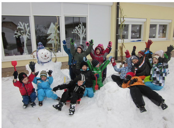
Zabava na snegu

Zima brez snega, bi ne bila zima. Kako čudovito je s prijatelji na snegu.