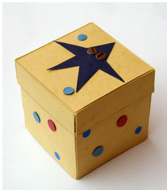
Izdelala: Katarina Šuster, 6. a

Predstavljen je izdelek učenke 6. razreda pri predmetu TIT. Narisan je plašč embalažne škatle za zlatino. Risba se imenuje delavniška risba.