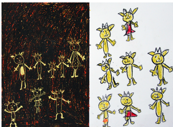
GAJA HOMEČ, 1. B