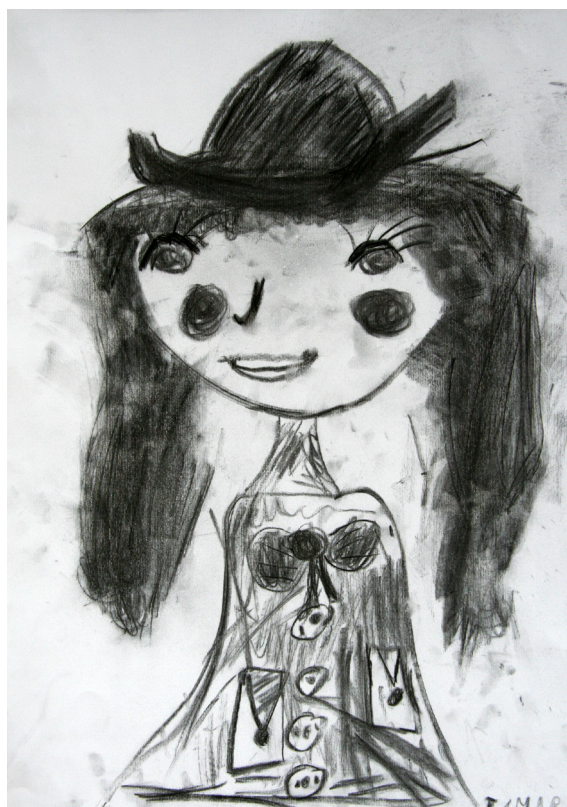
TAMARA ROTAR, 1. A