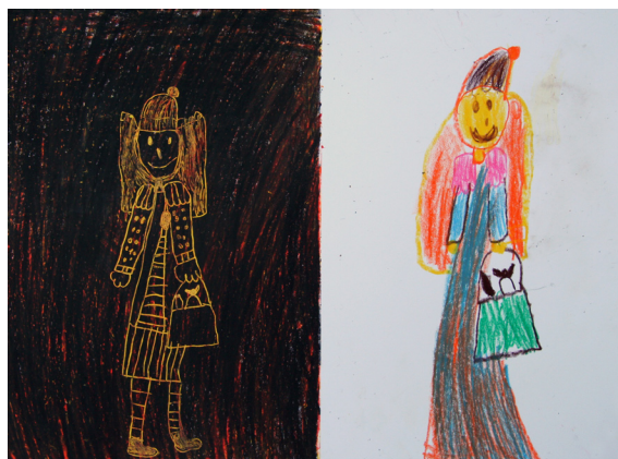
LARA HERCOG, 1. B