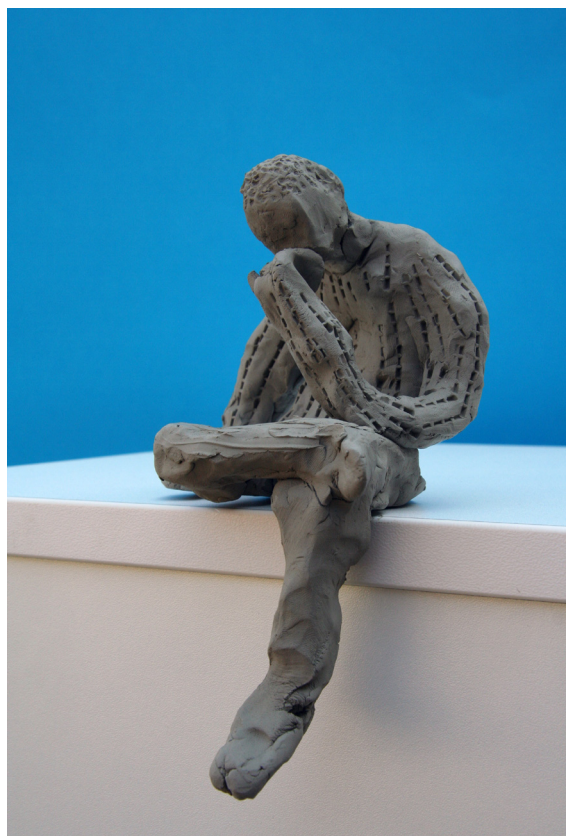
Blaž Turk, 9. a