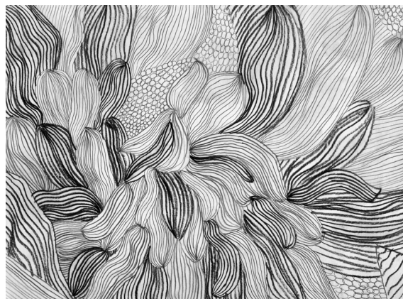
Lana Lašič, 6. a