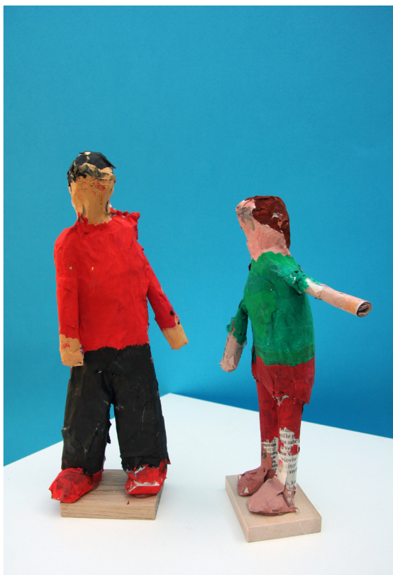
Kaširana plastika, 7. a