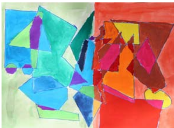
Blaž Kurnik, 4. b