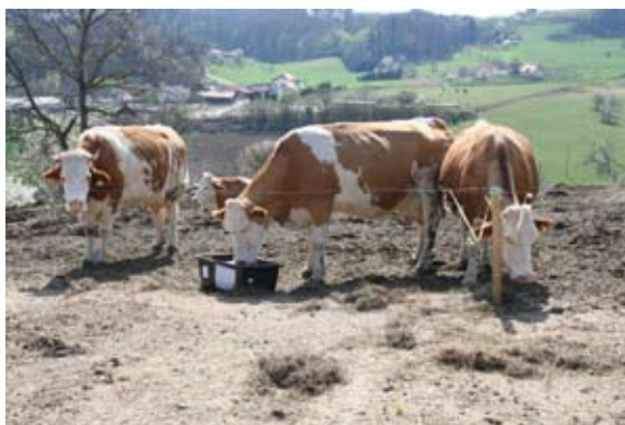
Krave na kmetiji Rojko