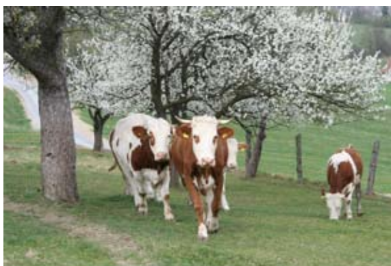
Krave na kmetiji Kurnik