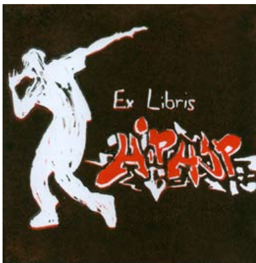
Valentina Tuš, 9. b