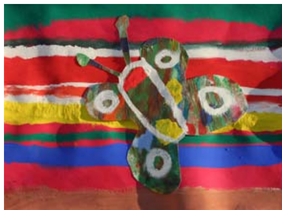
Katarina Leš, 4. a

Takrat, ko avto vozimo, na prometne predpise ne pozabimo.