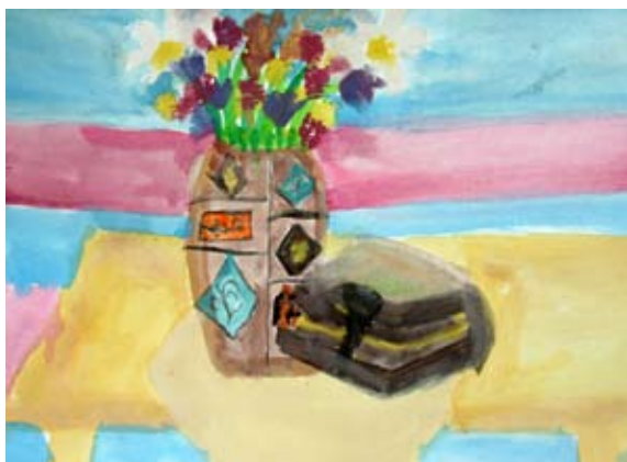
Iva Šuman, 3. b