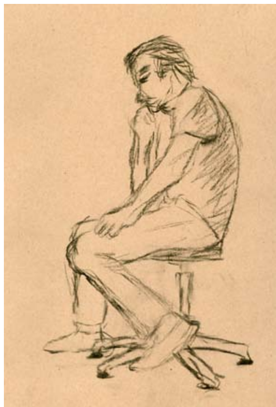
Anja Ornik, 9. b

Z njo ustvarjen bil je naš čudovit planet, ki nam življenje omogoča že vrsto let. Pitne vode je vsako leto manj,