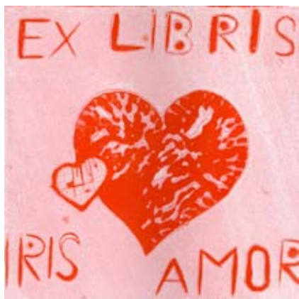
Iris Čuček, 9. b