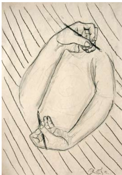
Blaž Turk, 8. a