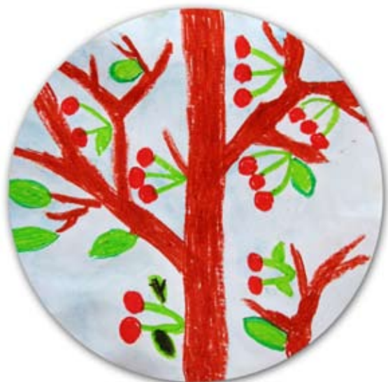
Tadej Hegedič, 3. b