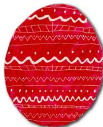
Oskar Šrmpf, 3. a