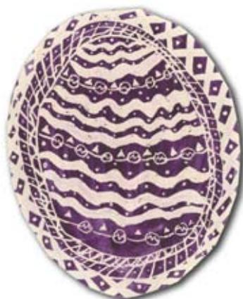
Žana Žabčič, 3. a