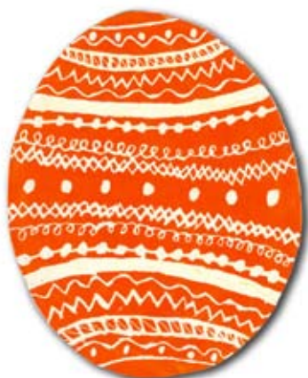
Ines Tašner, 3. a