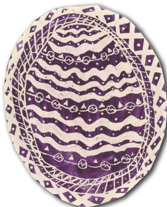
Žana Žabčič, 3. a