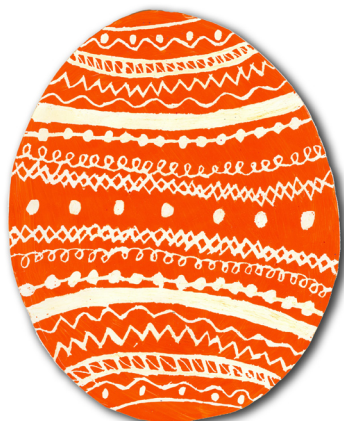
Ines Tašner, 3. a