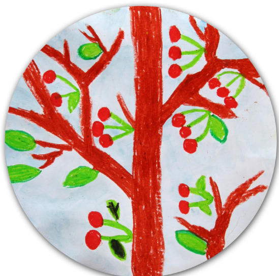
Tadej Hegedič, 3. b