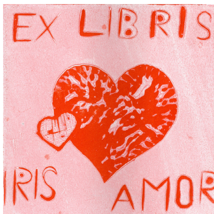
Iris Čuček, 9. b