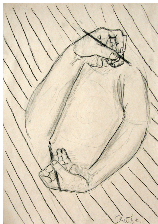
Blaz Turk, 8. a