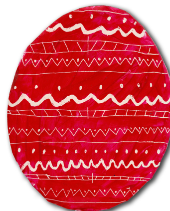
Oskar Šrmpf, 3. a