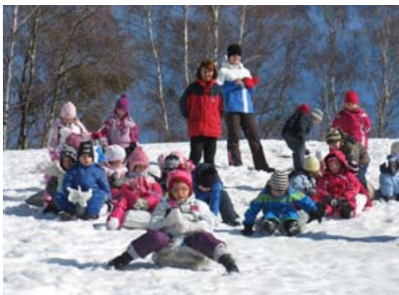
Kako čudovito se je sankati.

Hitro, hitro, snežna strmina že čaka na sankanje. OOO, kako zabavno je sankanje s prijatelji.