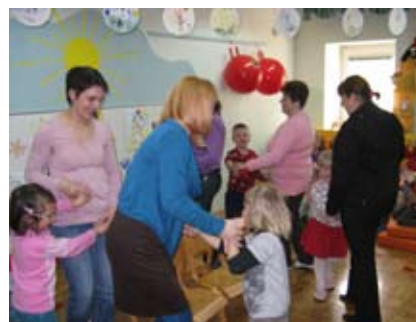
Slika 8: Ples z mamicami