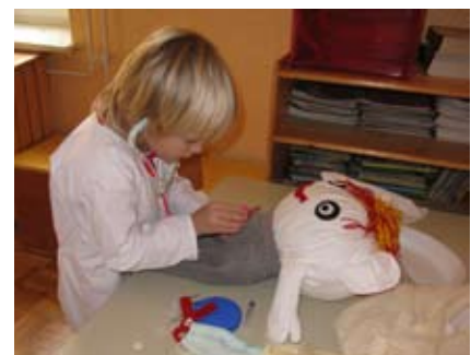
Slika 6: Dobrovoljček na pregledu