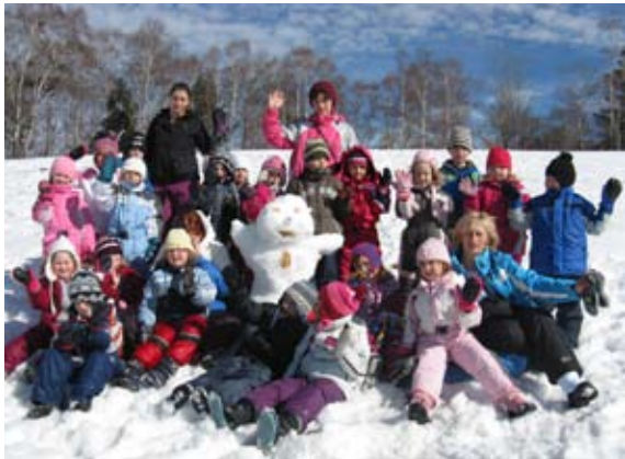
Naša ekipa na zimovanju.

V našem vrtcu se vsako leto odpravimo na zimovanje oziroma na letovanje predšolskih otrok, ki so stari pet let. Otroci doživljajo prve radosti na snegu, krajše in daljše sprehode z vodiči, stik z naravo ter še veliko drugih doživetij. To je za nekatere otroke tudi prva daljša ločitev od staršev, zato se trudimo, da smo na to dobro pripravljeni in da imamo pester program ves čas zimovanja.