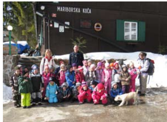
Naš planinski pohod.