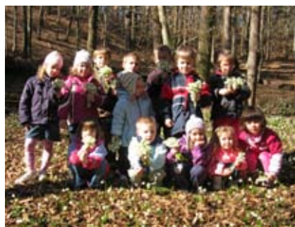
Slika 7: Pomladne rožice