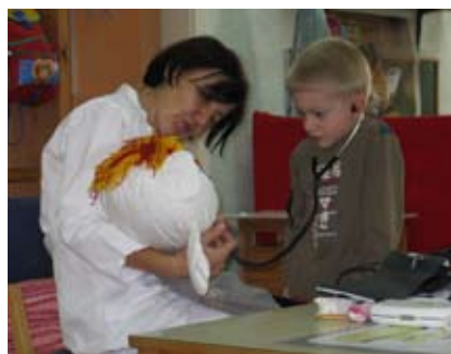
Slika 5: Dobrovoljček na pregledu