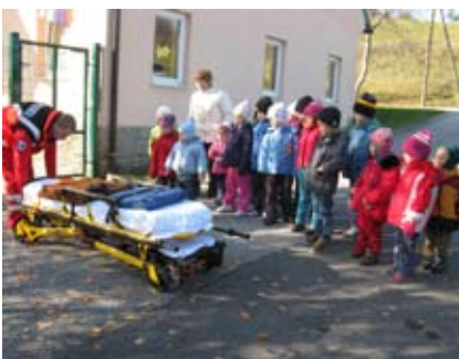
Slika 4: Poglejte, kam položijo ponesrečenega