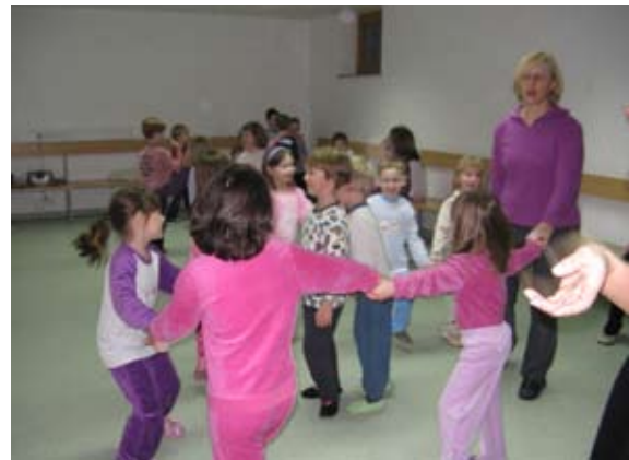
Zabava s prijatelji iz Lovrenca.

Na zimovanju v domu Planinka so bili tudi otroci iz Lovrenca na Pohorju. Da se bolje spoznamo in skupaj kaj zapojemo in zaplešemo, smo se dogovorili za »pižama party«.