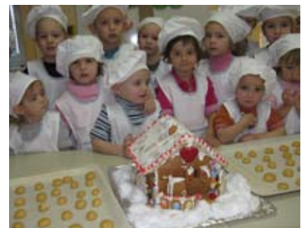
Slika 3: Naj slaščičarji v vrtcu