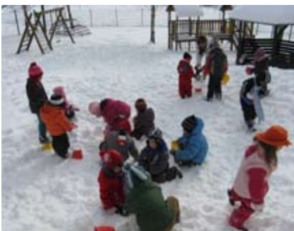
Slika 1: Veselje na našem zasneženem igrišču

Otroci skupine Vrabčki z vzgojiteljicami