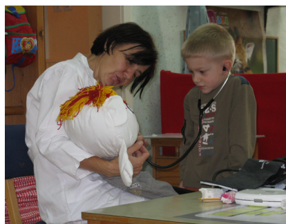
Slika 5: Dobrovoljček na pregledu