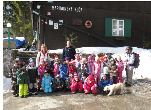
Naš planinski pohod.