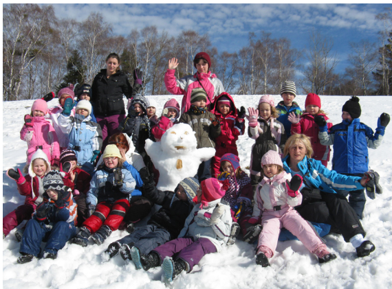
Naša ekipa na zimovanju.

V našem vrtcu se vsako leto odpravimo na zimovanje oziroma na letovanje predšolskih otrok, ki so stari pet let. Otroci doživljajo prve radosti na snegu, krajše in daljše sprehode z vodiči, stik z naravo ter še veliko drugih doživetij. To je za nekatere otroke tudi prva daljša ločitev od staršev, zato se trudimo, da smo na to dobro pripravljeni in da imamo pester program ves čas zimovanja.