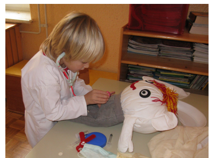
Slika 6: Dobrovoljček na pregledu