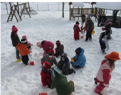
Slika 1: Veselje na našem zasneženem igrišču

Otroci skupine Vrabčki z vzgojiteljicami