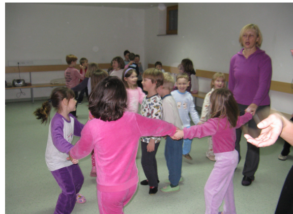
Zabava s prijatelji iz Lovrenca.

Na zimovanju v domu Planinka so bili tudi otroci iz Lovrenca na Pohorju. Da se bolje spoznamo in skupaj kaj zapojemo in zaplešemo, smo se dogovorili za »pižama party«.