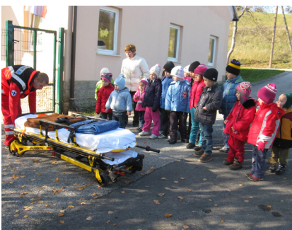
Slika 4: Poglejte, kam položijo ponesrečenega