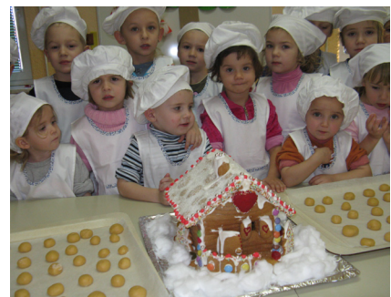
Slika 3: Naj slaščičarji v vrtcu