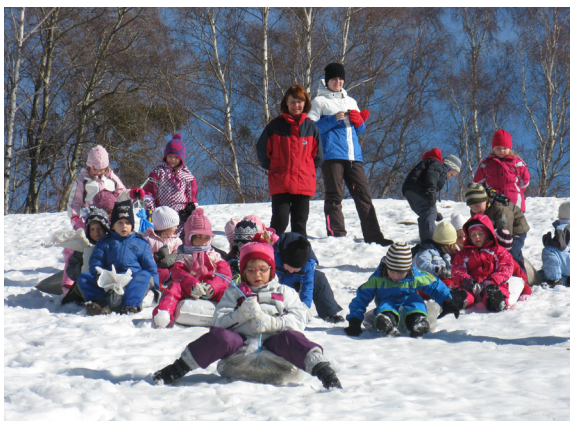
Kako čudovito se je sankati.

Hitro, hitro, snežna strmina že čaka na sankanje. OOO, kako zabavno je sankanje s prijatelji.