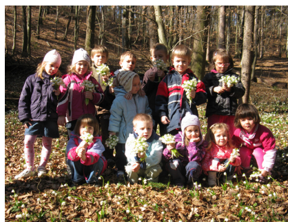
Slika 7: Pomladne rožice