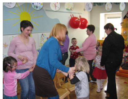
Slika 8: Ples z mamicami