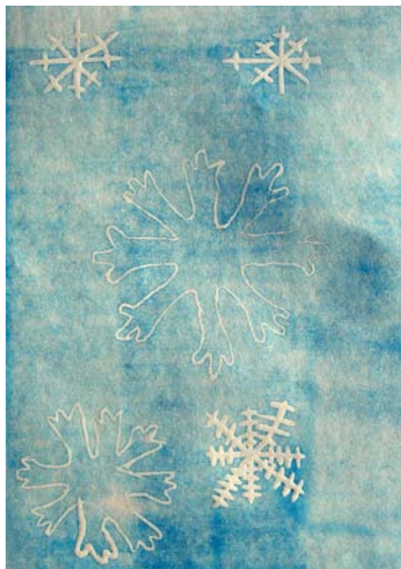
Natalija Krajnc, 5. a

V pravljici nastopajo naslednje književne osebe: pogumni krojaček, kralj in kraljična. Najdemo pa tudi veliko pravljicnih bitij: velikani, samorog in verper. Krojaček je bil sicer zelo siromašen, vendar kljub temu zelo pogumen, prebrisan, iznajdljiv in pameten. Vedno se mu je porodila kakšna dobra zamisel, ki jo