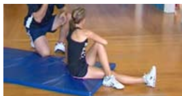
Vaja 3: Razstezanje hrbta