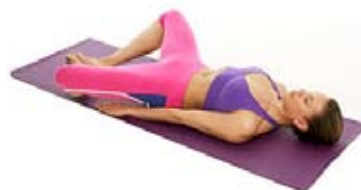
Vaja 5: Hrbtni metulj