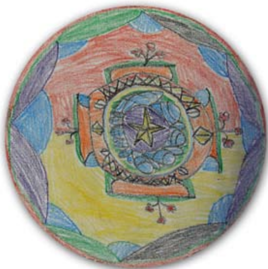
Luka Šket, 3. a