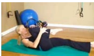
Vaja 1: Pilates vaje - kolesarjenje