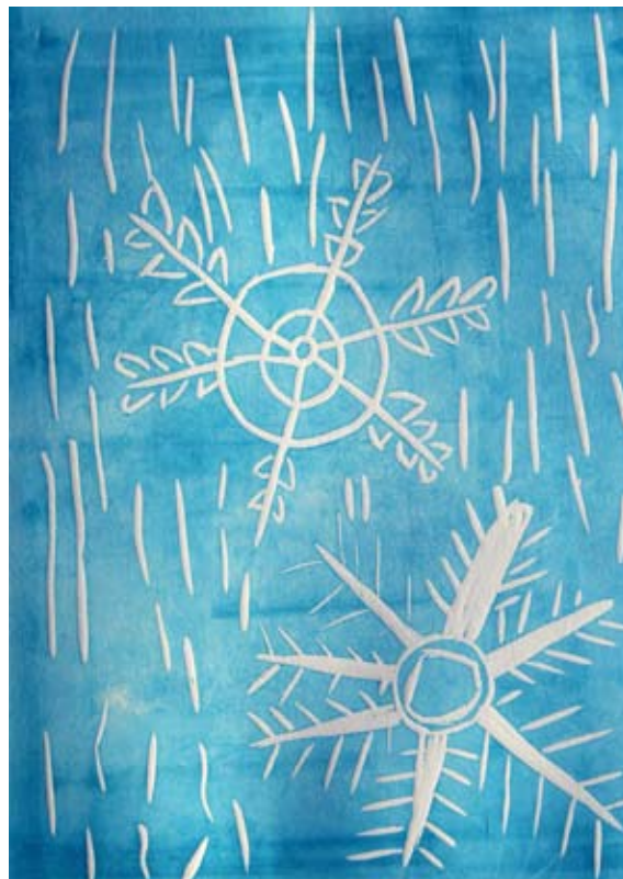
Mitja Klobasa, 5. a