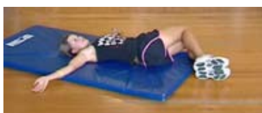
Vaja 2: Zibanje kolen