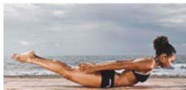
Vaja 7: Krepitev hrbtnih mišic