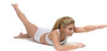
Vaja 6: Plavanje na suhem