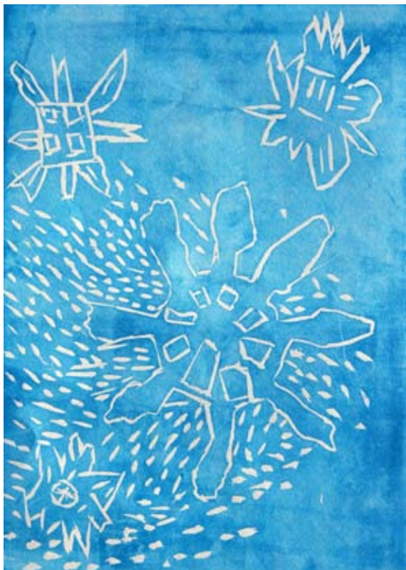
Tit Šuman, 5. a