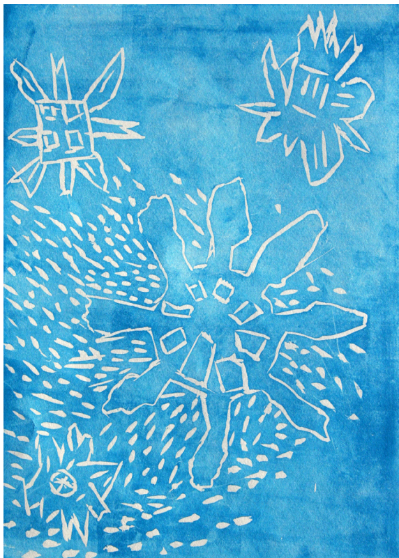
Tit Šuman, 5. a