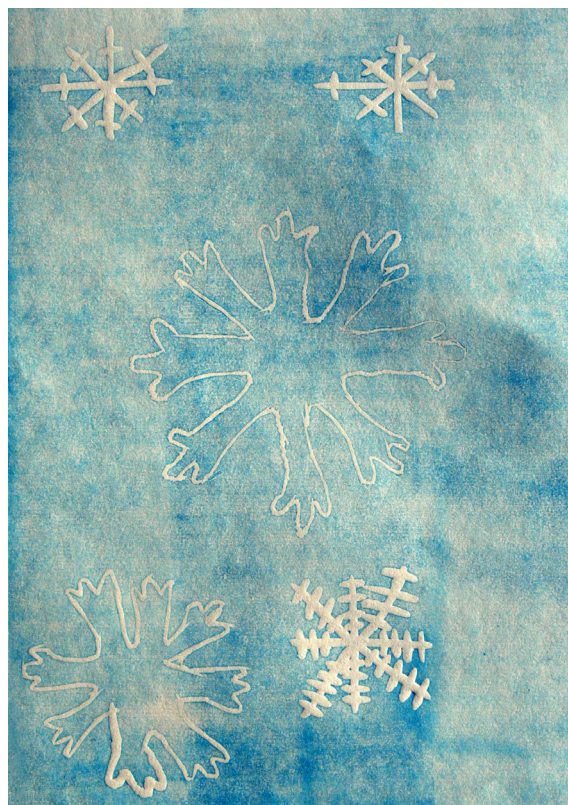
Natalija Krajnc, 5. a

V pravljici nastopajo naslednje književne osebe: pogumni krojaček, kralj in kraljična. Najdemo pa tudi veliko pravljicnih bitij: velikani, samorog in verper. Krojaček je bil sicer zelo siromašen, vendar kljub temu zelo pogumen, prebrisan, iznajdljiv in pameten. Vedno se mu je porodila kakšna dobra zamisel, ki jo