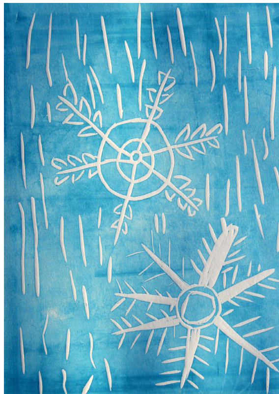
Mitja Klobasa, 5. a