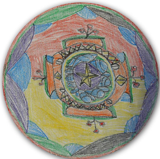
Luka Šket, 3. a