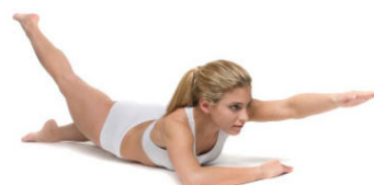
Vaja 6: Plavanje na suhem