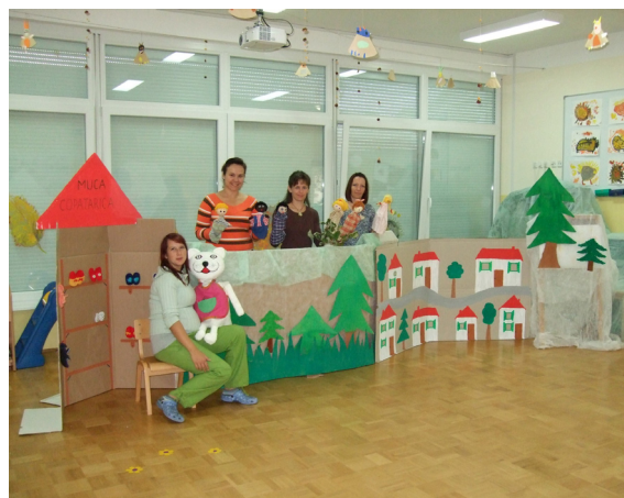
Predstava v vrtcu v Voličini.

ka. Lutke zmeraj pritegnejo pozornost otrok, otroci se umirijo in vstopijo v vizualni svet zgodbe ter se identificirajo s karakterjem lutke.