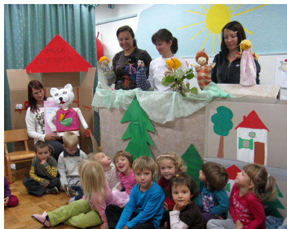
Predstava za otroke vrtca v Selcih.

Naš namen je približati otrokom lutke ob petju in pripovedovanju zgodb, ki se razlikuje od vsakdanji-