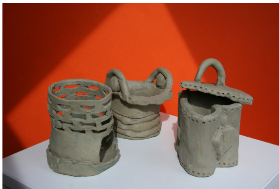
Votla plastika, 8. r.