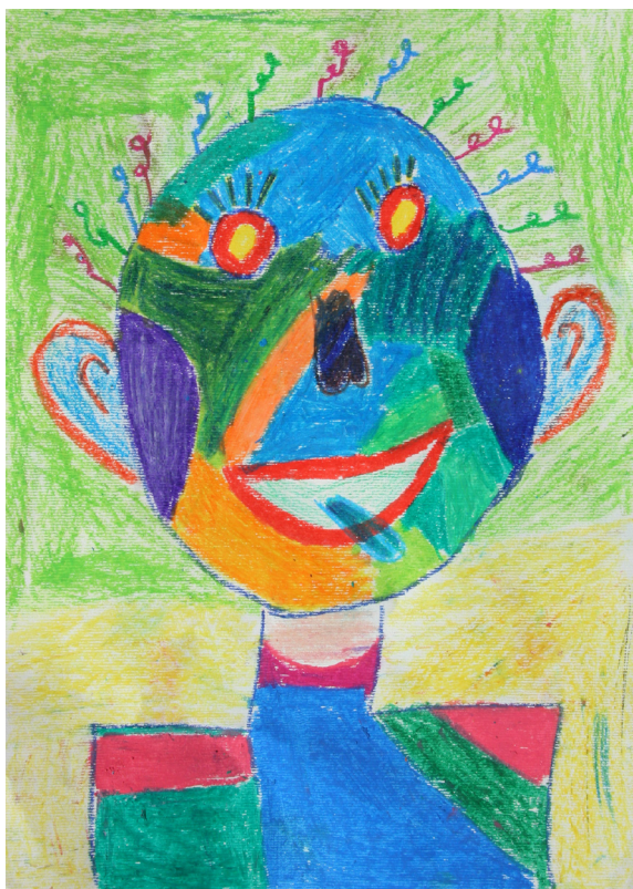
Tinkara Sternad, 7. a