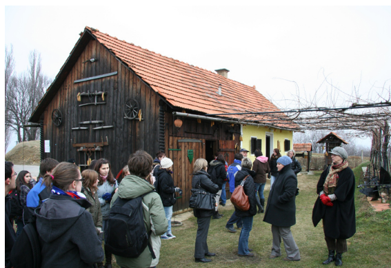
Obisk lokalnega muzeja

V ponedeljek sem obe pričakala v Voličini na avtobusni postaji, nato sem ju odpeljala domov, kjer sem ju predstavila družini, nato sta se nastanili v sobi