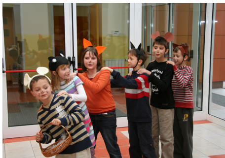
Program za udeležence