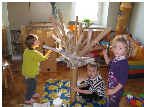
Naše drevo iz tulcev, ki smo jih zlepili, oblepili s papirjem in kasneje še pobarvali.

Ker imamo zelo radi naravo in drevesa, smo se tudi letos vključili v projekt Z igro do turističnih korakov v okviru spoznavajmo naše gozdove - Moje drevo. V vrtcu smo si izdelali naše eko drevo iz odpadnega materiala.