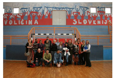
Skupinska fotografija učiteljev