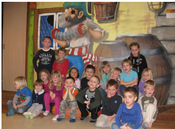
Pri teh gusarjih je bilo zelo zabavno.