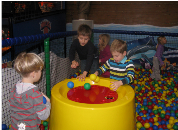
Bazen barvnih žogic in mi.

Le kaj počnete v teh hladnih zimskih dneh? Se dolgočosite? Mi se ne. Pri nas v vrtcu je zmeraj veselo, pa če tudi ni snega. Ker ni snega, smo naš cici športni dan preživeli v Bumar parku v Mariboru. Bilo je zelo zabavno in dejavno, bilo je veliko igral in plezal. Tamkajšnjo gusarsko ladjo smo zavzeli otroci iz skupine Vrabčki, Sončki in Lunice.