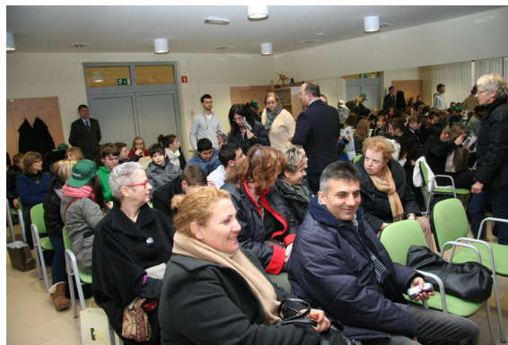
Sprejem pri županu

Od 31. januarja do 4. oziroma 5. februarja je na naši šoli potekalo srečanje držav partneric v okviru projekta COMENIUS. Ponedeljkovo jutro je bilo za vse nas, ki smo pričakovali goste iz drugih držav (Danske, Francije, Cipra, Nemčije, Finske in Turčije), drugačno od ostalih šolskih dni.