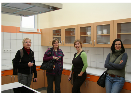
Navdušenje gostujočih učiteljev nad našo šolo je bilo zaznati na vsakem koraku.