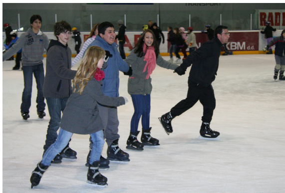
Na drsanju je bilo zelo zabavno.