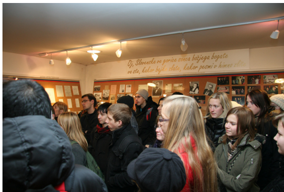
V spominski sobi Rudolfa Maistra

Izvedba tega projekta je financirana s strani Evropske komisije. Vsebina publikacije (komunikacije) je izključno odgovornost avtorja in v nobenem primeru ne predstavlja stališč Evropske komisije.