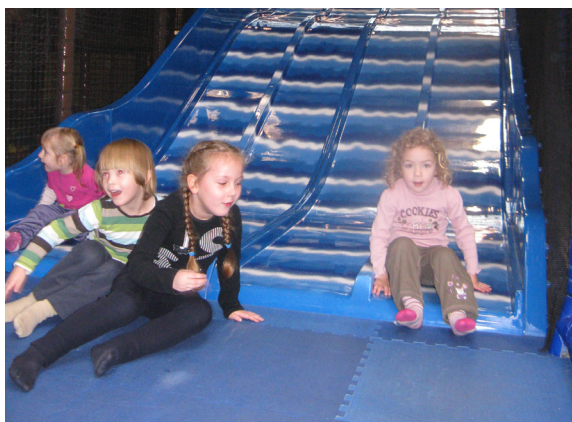
Tobogan kot veliki valovi, joj, kako je drselo.

Kaj vse lahko opazujemo na sprehodu pozimi? Drevesa. Zima, bela starka, nam snega ni nasula, je pa okrasila drevesa s čudovitim ivjem.