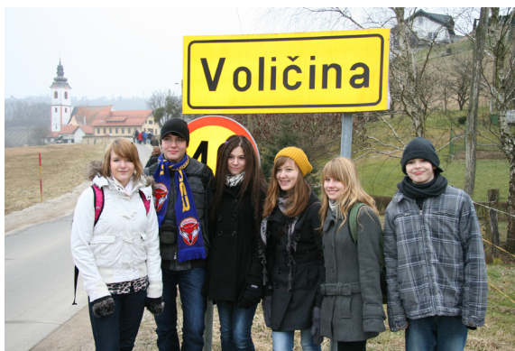
Priljubljena točka za fotografiranje (na fotografiji so vsi gostujoči učenci iz Nemčije)