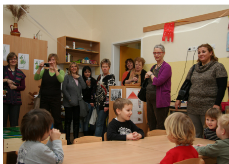
Na obisku v vrtcu