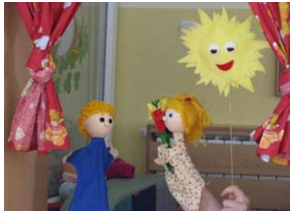
Lutkovna predstava Moja mamica

Skupaj smo si ogledali film – Jaz v vrtcu, kjer smo posneli naš vsakdan v vrtcu, da so mamice opazile, kako smo že samostojni, pridni, predvsem pa, da se vsak dan zabavamo in rastemo z igro. Všeč so nam bile tudi lutke, ki so odigrale predstavo Moja mamica.