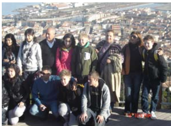
Udeleženci srečanja v mestu Sete