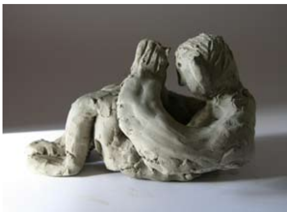
Žiga Strmšek, 6. a