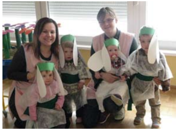
Prve spomladanske marjetice

Jaz imam pa goslice, goslice zveneče, ki pojo mi pesmice, pesmi zlate sreče. Jaz imam pa rožico, mamico ljubečo, ji zapojem pesmico in prinesem srečo.